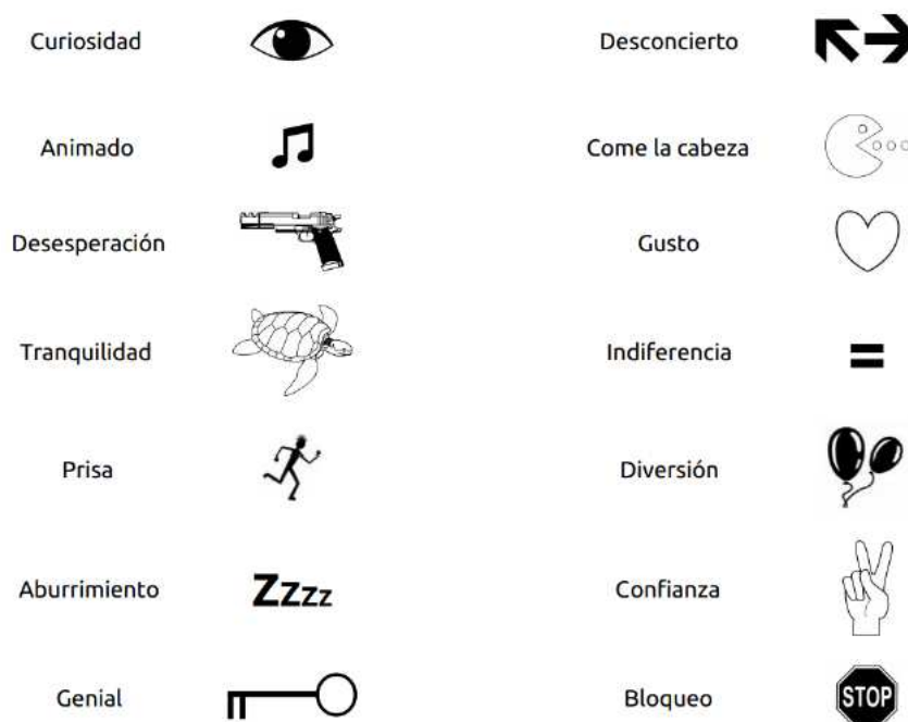
Figura 2. Estados emocionales representados en el mapa de humor de los problemas. Adaptado de Gómez-Chacón (2000).

El inconveniente de tomar los datos con una entrevista o con un cuestionario es que proporcionan información sobre el estado afectivo en un momento dado. Transcurrido un mes desde la aplicación de este instrumento, los afectos de los estudiantes pueden haber variado considerablemente. Obviamente, aquellos afectos más persistentes, como intereses y creencias, precisan de intervalos de tiempo más largos para modificarse. Sin embargo, las emociones son instantáneas. De nada nos sirve un cuestionario que evalúe emociones una sola vez. Si acaso como nivel de partida, pero no más allá. Idealmente, tendríamos que aplicar un cuestionario en todas las sesiones, al principio y al final, cosa que no es viable ni útil.