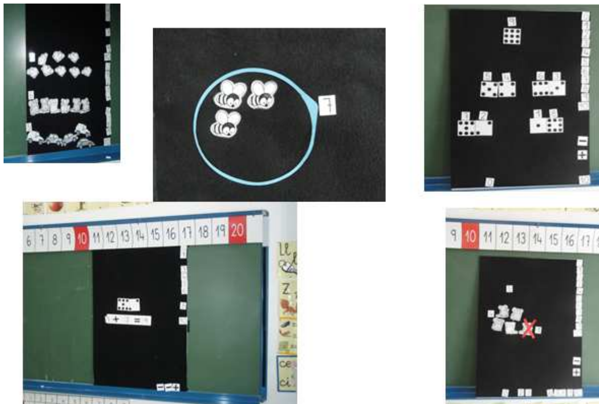
Figura 2. Elementos para trabajar con el flanelógrafo

Además se usan los signos de las operaciones y otros elementos que ayudan en la representación gráfica (Figura 2).