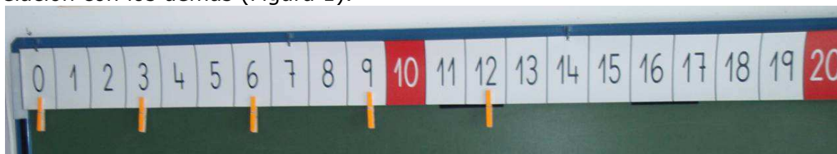
Figura 1. Cinta numérica

En la cinta, el aprendizaje de cada número no se realiza de manera aislada, sino como parte de secuencias más amplias. Esto enriquece el contexto de aprendizaje ya que cada número aporta información sobre sí mismo pero en relación con los demás (Figura 1).