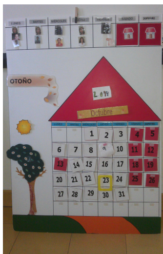
Figura 3. Calendario