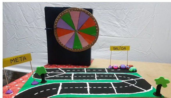
Figura 1. Juego ¡Voy a ser el más rápido!

La variación del juego más destacable que propusieron las estudiantes consistió en emplear una ruleta en lugar de los dados para determinar la ficha que avanza, siendo un coche en su caso. Así pues, se va haciendo girar la ruleta y se mueve el coche en cuyo color se para la ruleta. Esta está pensada para ser reconfigurable según avanza el juego mediante un sistema adhesivo (Figura 1). La ruleta, que es un material clásico en la enseñanza y aprendizaje de la probabilidad, proporciona una experiencia diferente a la de los dados, puesto que se trata de sucesos simples (“rojo”, “verde”, etc.) pero no necesariamente equiprobables. De esta manera, para escoger el coche (ficha) con mayor probabilidad de victoria hay que elegir el color de la ruleta cuyo sector presenta mayor área. En cualquier caso, como veremos, el instrumento generador de eventos aleatorios cambia dependiendo del número de jugadores.