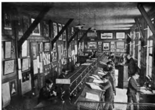
Figura 5. “Escritório comercial” simulado na Escola Académica (Escola Académica, s/data, p. 45)

Não é apenas no sistema público que se vão criando escolas comerciais. A pouco e pouco, vão sendo criadas escolas privadas ou associações profissionais que incluem cursos de formação comercial. A Escola Académica foi fundada em Lisboa em 1847 e foi pioneira ao reunir valências de instrução primária, secundária e profissional, num mesmo estabelecimento de ensino. Para além de diversas inovações nos métodos de ensino, o seu Curso Comercial instituído em 1895 foi o primeiro organizado numa escola privada portuguesa.