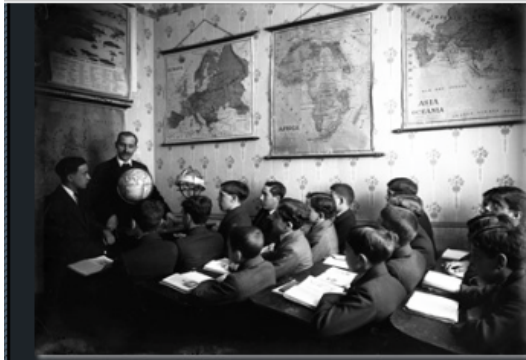
Figura 3. Escola prática de comércio de Lisboa, (séc. XIX) (Blogue “Restos de Coleção”)

das, respetivamente à Câmara de Comércio e Industria de Lisboa e à Associação Comercial do Porto (Pardal, Ventura e Dias, 2003).