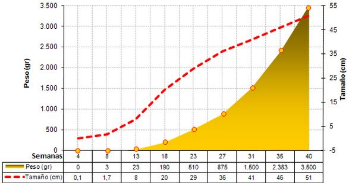
Ilustración 1. Evolución semanas del peso y tamaño del feto.

A continuación se presentan algunos de los modelos que suelen usarse para ilustrar información con respecto al tema. Obsérvelos, discútalos con sus compañeros y escriba la información que usted considera que puede encontrarse en dichos modelos.