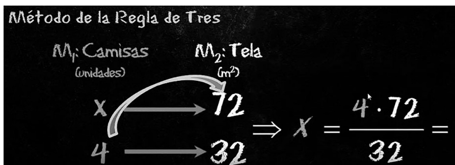
GRÁFICO 3. Captura de pantalla en el minuto 11:47. Método de la regla de tres.

(11:35) «Las magnitudes se colocan en forma de columna: ponemos x es a 72 como 4 camisas es a 32».