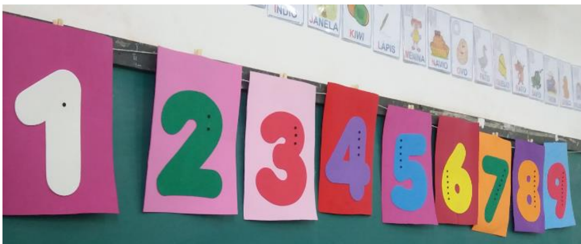
Figura 3: Varal dos Números

É imprescindível expor que “não é qualquer curiosidade, mas é a que está ligada ao difícil, mas prazeroso, ato de estudar. É a própria consciência crítica e se desenvolve no processo de conscientização” (FREITAS, 2017, p.108).