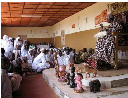
Imaxe 6: O oba de Ketou. Instantánea realizada no ano 2006

En África, o xogo do mancala, engloba varios tipos de xogos: na zona ao norte do Golfo de Guinea, coñecida como África non bantú, o taboleiro está formado por dúas ringleiras de seis ocos cada unha; na zona situada ao sur do citado Golfo, a África bantú, o taboleiro ten catro ringleiras e na zona de Somalia e Etiopía os taboleiros teñen tres. Segundo o primeiro dicionario fon-francés, publicado polo sacerdote español, o padre Seguro, o Mancala caracterízase por ser un xogo de cálculo que varía segundo o xeito de xogar e o número de ajikwin , que son as sementes que hai en cada burato. Algunhas das variantes son Aklu , Atondu , Enexodu , Xwenumé e Kowolodu . En todas estas versións o gañador é o xogador que logra facerse con máis ajikwin .