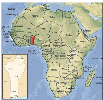
Imaxe 4: Benín

O país de Benín non se viu libre da lacra da escravitude, unha proba é a cidade de Ganvie, coñecida como a “Venecia africana”. É a cidade lacustre máis grande de África, está asentada no lago Nokoué e foi construída polos toffis a principios do século XIII. Cando os guerreiros fon eran enviados pola realeza para a captura dos habitantes das zonas rurais e a súa venda posterior no comercio de escravos, as xentes de Ganvie trasladaron as súas vivendas ao lago, xa que as tradicións relixiosas do país impedían que os ataques tivesen lugar sobre a auga. É por iso que Ganvié , na lingua toffi , significa “Comunidade Salvada”.