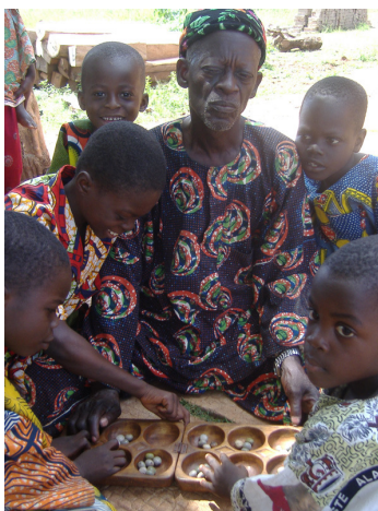
Imaxe 7: Rúa de Gbanamé, novembro de 2006

A variante do xogo que se vai a mostrar é a da zona de Benín. Xógase entre dúas persoas por quenda. O taboleiro colócase entre os xogadores, de xeito que cada xogador teña diante unha ringleira de seis ocos, en cada oco colócanse catro sementes.