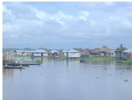
Imaxe 5: Ganvie, coñecida como a “Venecia africana”

Ademais dos toffis e fon , outra etnia importante nese país é a dos yoruba . A cidade de Ketou situada ao sueste de Benín, próxima a Nixeria, está considerada como a capital dos yoruba en Benín. Existe a crenza de que os yoruba proceden de Exipto, o seu xefe espiritual é o Oba , cando concede audiencia hai que descalzarse e axeonllarse na súa presenza por orde xeracional como recolle a instantánea realizada no ano 2006.