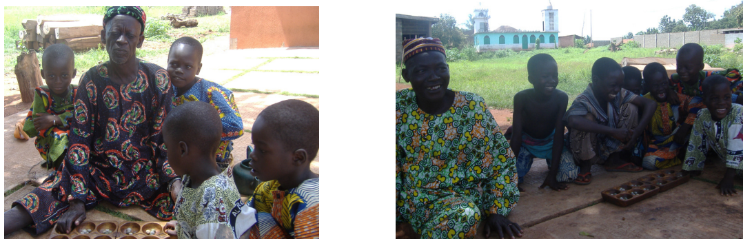
Imaxe 1: Rúa de Gbanamé, novembro de 2006

Explicábanse as regras do xogo facendo fincapé en que é un xogo de integración social, bipersoal, de estratexia e equitativo, xa que a ganancia dun xogador implicaría a perda do contrincante, pola contra, non se considera un xogo aleatorio posto que a información é completa. Por último, convidábase a botar unha partida ás persoas que se acercaban polo posto. Simultaneamente visualizábase unha presentación de Power-Point sobre o país de Benín con fotos da citada viaxe que remataba cunha explicación da forma de xogar do Aji .