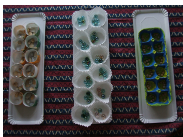
(a) Mancalas artesanais

Explicábanse as regras do xogo facendo fincapé en que é un xogo de integración social, bipersoal, de estratexia e equitativo, xa que a ganancia dun xogador implicaría a perda do contrincante, pola contra, non se considera un xogo aleatorio posto que a información é completa. Por último, convidábase a botar unha partida ás persoas que se acercaban polo posto. Simultaneamente visualizábase unha presentación de Power-Point sobre o país de Benín con fotos da citada viaxe que remataba cunha explicación da forma de xogar do Aji .