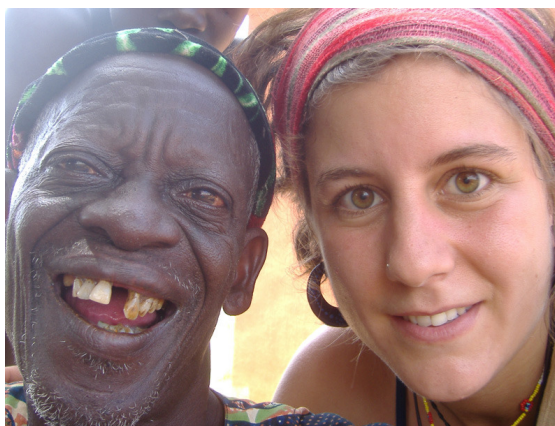
Imaxe 8: A xulgar polo sorriso, xa sabemos quen gañou

A partida remata cando o xogador gañador logra facerse coa maioría das sementes (vinte e cinco ou máis).