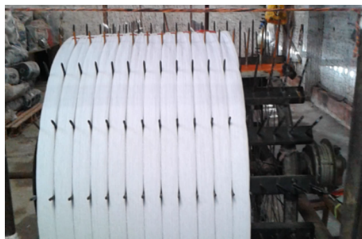
Figura 2 - Urdissagem elétrica adaptada