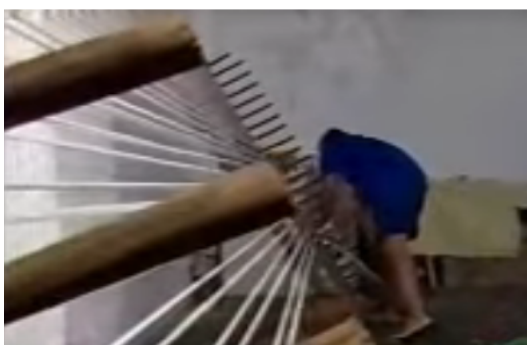
Figura 1 - Urdissagem manual