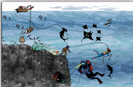
Figura 2 – OED "Equipamentos de mergulho"

Mais uma vez, uma singela relação com os números negativos apenas aparece no ícone "clique aqui antes de sair". Nesse sentido, de modo a possibilitar algum tipo de exploração “não domesticada” – não diretamente, mas decorrente da visualização do OED –, ao professor, para além de uma definição e significado dos números negativos (KoT) cumprirá um conhecimento relativo ao conceito de número e de operação, que sustenta os "porquês" associados à necessidade de um ponto/linha de referência que permita identificar o zero (KSM). Complementarmente, inclui possíveis conexões entre o sentido de número, números racionais e a História da Matemática, de forma a atribuir significado às diferentes representações e possíveis formas de as interpretar – dependendo do espaço de referência – que possibilite que os alunos ampliem (ou reforcem) o seu conhecimento sobre os conjuntos numéricos (KMP), fazendo uso de uma comunicação matemática adequada.