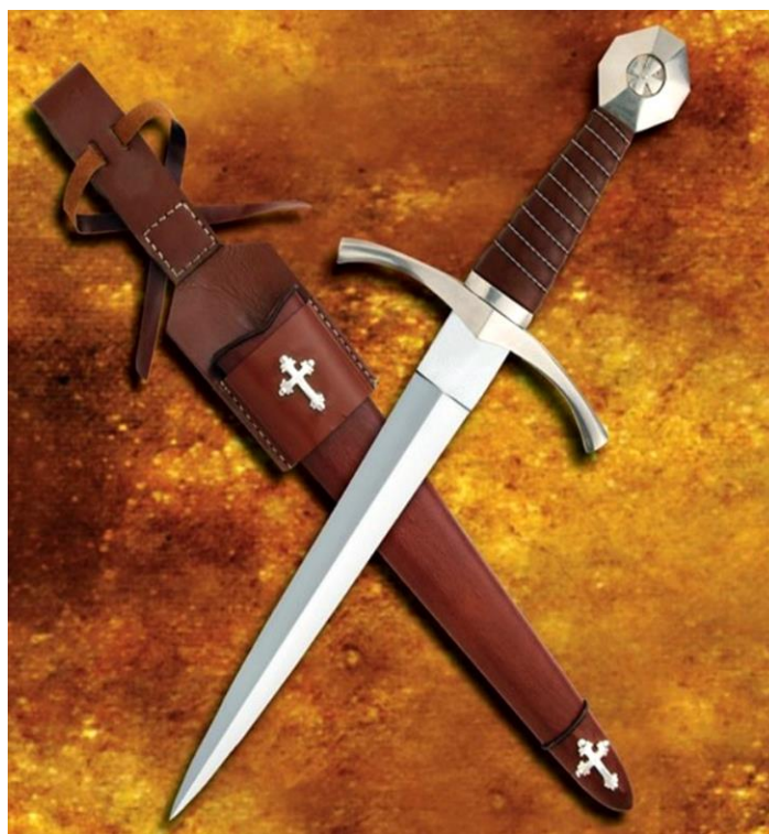
Figura 2: Daga templaria

62. Há muitas maneiras de humanos descreverem e de se comportarem diante de uma epidemia, imagens bélicas têm-se mostrado hegemônicas e persistentes. Veja esta réplica de uma adaga medieval templária com bainha 27 . Veja a cruz - o selo dos cavaleiros da ordem Pauperes commilitones Christi Templique Salomonici - na extremidade circular do seu cabo. – Veja também que a outra extremidade do cabo forma com a lâmina uma cruz. – Só que, nas adagas originais, a cruz era rubra , e não prateada, como aparece nesta réplica. – E o que isso tem a ver com epidemias? – Tem a ver com um certo modo como você conta um conto 28 . E como quem conta um conto sempre aumenta um ponto , despertou-me a curiosidade ver como era uma das armas usadas pelos templários em suas guerras santas travadas contra os muçulmanos. Eles acreditavam estar lutando, em nome de um deus, contra outro deus. Era uma luta entre deuses mascarados de humanos. – Ou então, de humanos mascarados de deuses.