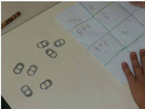
Figura 2: Criando adições.

Em seguida, foi solicitado que, individualmente, compusessem adições simples dentro de alguns retângulos e, nos retângulos ao lado, colocassem as respostas a essas contas (Figura 2).