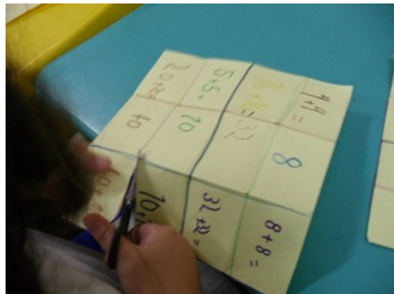
Figura 4: Recortando os retângulos.

Num outro momento de exercitação da coordenação motora, os educandos recortaram seus papéis,