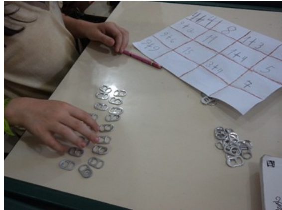
Figura 3: Utilização de material concreto na resolução da adição.

Essa tarefa foi muito proveitosa para o desenvolvimento do pensamento matemático já que cada aluno, ao montar suas próprias operações, explorou sua criatividade e, muitas vezes, utilizou o material para contagem a fim de se certificar da resposta correta (Figura 3).