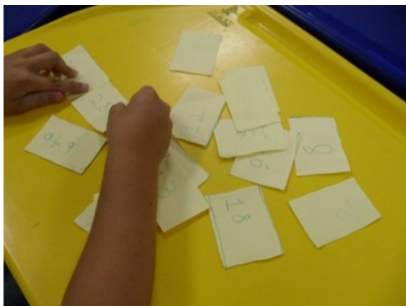
Figura 5: Conferindo o material confeccionado.

Nesse momento, a mediação da professora foi essencial, pois, ao passar de carteira em carteira, ela pôde indagar cada aluno (Que operação você fez? Qual é a adição? Que resultado você obteve? Etc.), agindo de acordo com as indicações dos Parâmetros Curriculares Nacionais (PCN), quando menciona a relação professor-aluno e aluno-aluno: