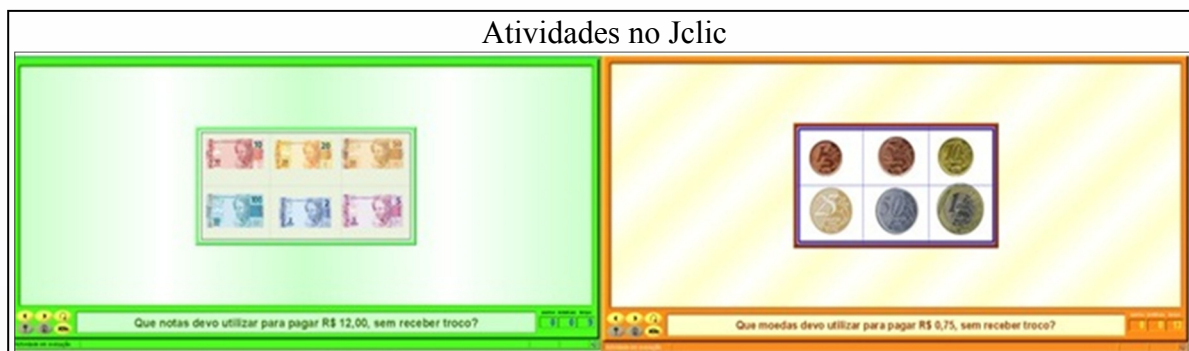
Figura 3: Quadro de atividades das sequências.

As experiências realizadas demonstram que trabalhar com sequências didáticas eletrônicas individualizadas, de acordo com as dificuldades que os estudantes apresentam é um caminho que possibilita qualificar o trabalho docente em busca da inclusão.