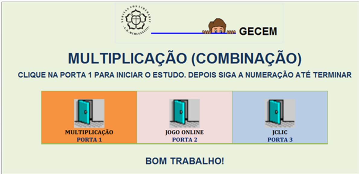
Figura 2: Porta de entrada do nodo oito da sequência da multiplicação.

Na figura 3 apresentam-se exemplos de atividades destas sequências: