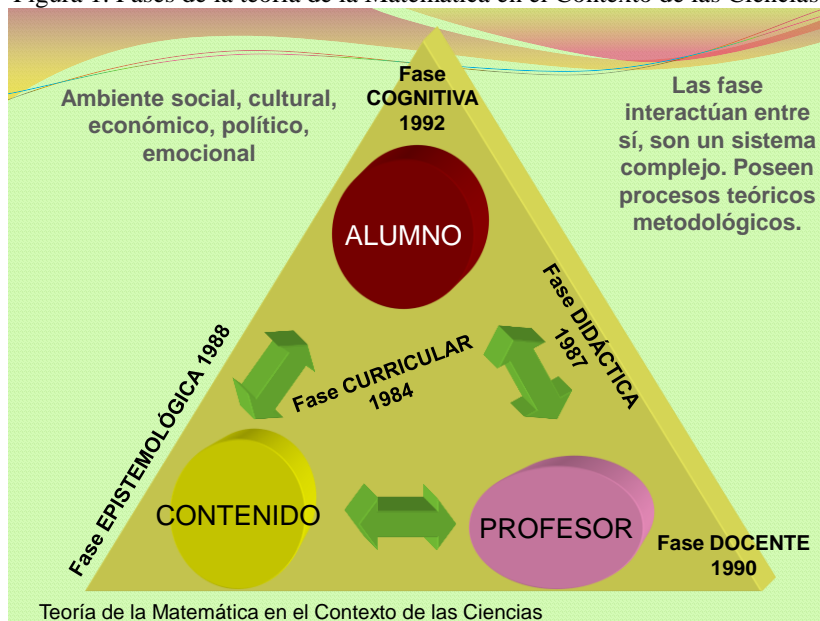
Figura 1. Fases de la teoría de la Matemática en el Contexto de las Ciencias.

Las fases de la teoría de la Matemática en el Contexto de las Ciencias son: Fase Cognitiva desarrollada desde 1992, Fase Didáctica iniciada desde 1987, Fase Curricular trabajada desde 1982, Fase epistemológica abordada desde 1988 y Fase Docente incluida desde 1990. En la figura 1 se muestra un triángulo didáctico, en donde se contempla una de las ternas doradas de la educación: alumno, profesor y contenido; en el triángulo se incluyen las fases de la teoría de la Matemática en el Contexto de las Ciencias (CAMARENA, 1990; TREJO et al, 2011, CAMARENA y FLORES, 2012). En el presente artículo se muestran sólo resultados de investigaciones que dan origen a la didáctica de la Matemática en Contexto, la cual se inserta en la Fase Didáctica de la teoría. Se incluye, de forma sintética, su fundamentación teórica, su descripción, así como su implementación en el aula.