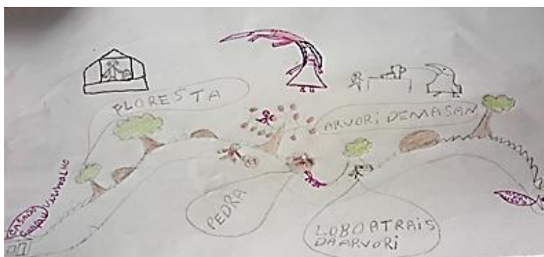
Figura 01: Produção dos alunos

Primeiramente foi apresentada aos alunos a leitura do livro Chapeuzinho Vermelho, uma aventura borbulhante . Após explorarem a leitura os alunos foram desafiados a desenhar o trajeto que o garoto da história tinha feito da casa dele até a casa de sua avó. Com isso, foram orientados a prestar bastante atenção nos detalhes da história e que fizessem anotações dos locais por onde Chapeuzinho Vermelho tinha passado. Neste momento todos os alunos ficaram concentrados na atividade. Vejamos uma produção: