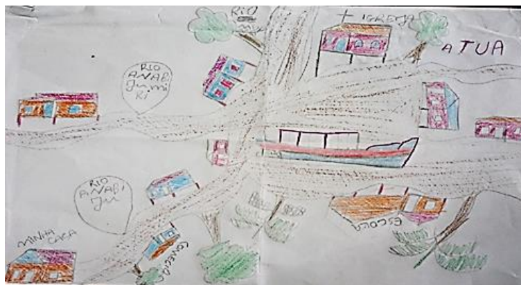
Figura 02: Produção dos alunos

Na fala do alfabetizador percebe-se que essa atividade possibilitou também conduzir os alunos ao reconhecimento de si próprios e da realidade que os circundam. Pois, a convivência de forma lúdica e prazerosa com textos literários favorece a formação do espírito crítico do leitor, aguça o seu desejo de transformar a realidade inserindo outras formas de ser e estar no mundo. Portanto, além do que foi comentado, essa atividade integrando língua portuguesa e matemática, rompeu com uma prática que se manifesta em muitas aulas de geometria, ignorar os sentidos, o próprio corpo e as experiências dos estudantes em relação ao espaço, reduzindo o estudo da geometria a figuras planas. Vale a pena destacar, a importância de explorar os conhecimentos sobre ocupação do espaço que as crianças trazem, o vocabulário que usam, os esquemas de representação que possuem e as noções de lateralidade que elas já têm. Estes são cuidados iniciais muito importantes, tanto porque muitos dos alunos não passaram por um processo de alfabetização matemática.