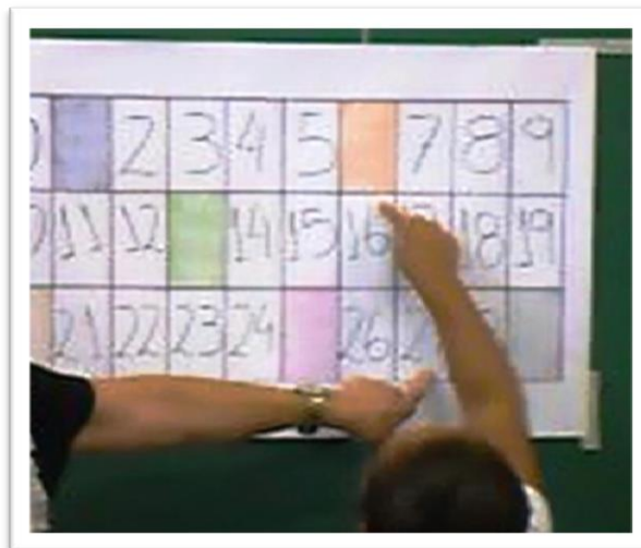
Figura 4 – Exploração do quadro numérico

Após alguns minutos, a P1 pareceu perceber a necessidade de explorar as regularidades, começou então a fazer perguntas aos alunos para instigá-los a buscar por regularidades: "O que tem de igual nos números desta coluna?" - apontando a coluna do número 7. "E na coluna do número 1?". Imediatamente os alunos percebem a repetição dos algarismos 7 e 1 nas respectivas colunas e discutiram o valor posicional destes algarismos nos números do quadro. Neste momento percebe-se o indício de improvisação até mesmo porque a improvisação foi decorrente de algo que não foi previsto no planejamento da atividade do EMAI. Pode-se dizer que o imprevisto de P1 permitiu o processo de generalização por parte das crianças na identificação do valor posicional dos algarismos dos números presentes e ausentes num determinado intervalo.