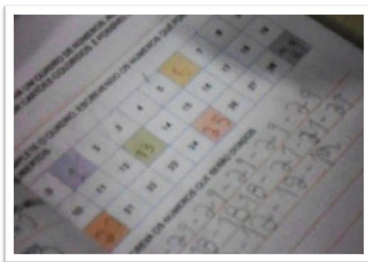
Figura 3 – Escrita numérica repetida

Também ocorreram alguns problemas quanto à gestão das ações empreendidas. Vale destacar que a professora repetiu muitas vezes os números durante o ditado e circulou pela sala fazendo intervenções, descaracterizando a proposta da atividade, em que os alunos deveriam registrar os números ditados consultando ou não o quadro numérico disponível na atividade. Tal atitude causou morosidade na tarefa, vários alunos ficaram dispersos e agitados, alguns revelaram dificuldades e não receberam auxílio, pois a professora estava tentando conter alunos que circulavam pela sala. Observou-se também que dois alunos preencheram as linhas da atividade escrevendo repetidas vezes os números ditados pela professora (figura 3).