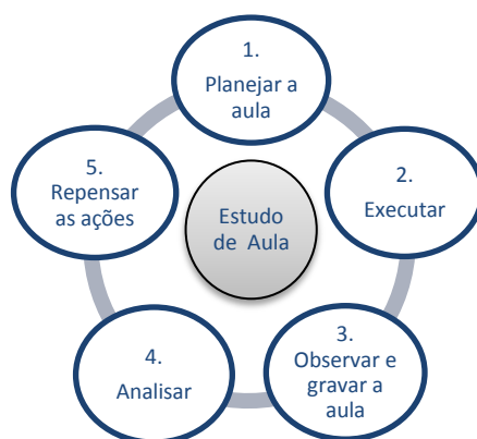
Figura 1- Ciclo de acompanhamento do pesquisador

O evento ocorreu em dois encontros de formação e uma visita à escola. A aula foi aplicada pela P1, mas foi planejada e analisada de maneira colaborativa pela pesquisadora e a dupla de professoras do 1º ano. Para isso, foram seguidas as etapas previstas para o Estudo de Aula, no sentido explicitado por Ponte et.al (2012) como um processo iterativo de planejamento, observação e revisão de aula em que professores e pesquisadores atuam em conjunto no sentido de melhorar as aprendizagens dos alunos, que foram reorganizadas para atender as intenções da pesquisadora durante o acompanhamento do processo: