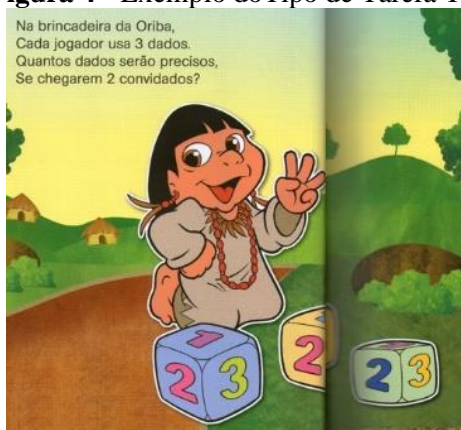
Figura 4 - Exemplo do Tipo de Tarefa T6.

O tipo de tarefa apresentada na Figura 3, por sua vez, é retirar quantidades de um total . No enunciado da situação-problema, é questionado a quantidade de bolhas que restará se três forem estouradas de um total de 10. Diante disso, a técnica para a resolução consiste em retirar três de 10, também por meio de contagem com auxílio da ilustração da história. Mas, uma vez, estamos diante de um tipo de tarefa “autotecnológica” que torna desnecessária a justificativa. Já a teoria se insere-se no campo das operações numéricas, mais especificamente, trata da operação subtração no conjunto dos números naturais.