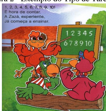
Figura 2 - Exemplo do Tipo de Tarefa T1

Nesta segunda parte, procedemos à análise praxeológica dos tipos de tarefas identificadas como T1, T3 e T6. Para tanto, exemplificaremos cada uma delas a partir da obra “Histórias de Contar”. Ademais, ressaltamos que iremos considerar em cada situação-problema a mesma organização praxeológica de acordo com o tipo de tarefa, isto é, nas duas situações-problema do tipo contar quantidades (T1), a técnica, a tecnologia e a teoria serão análogas, como seguem: