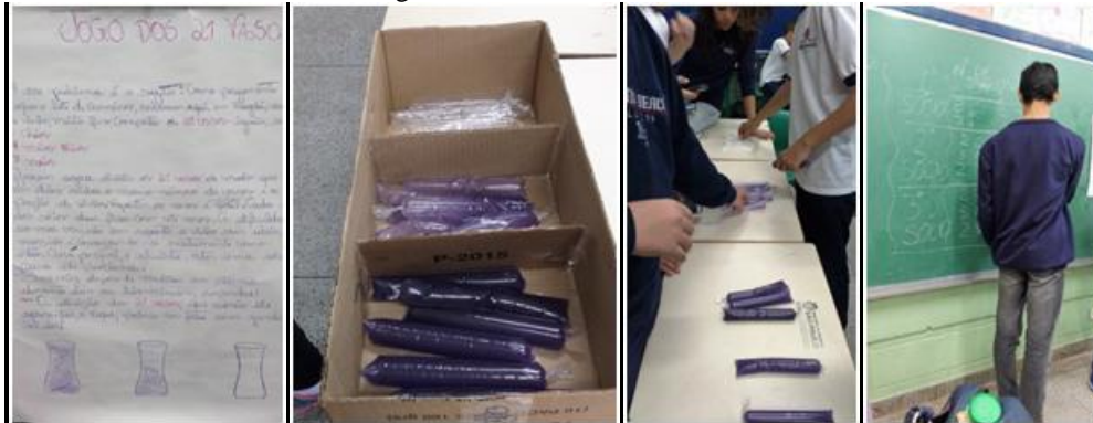
Fig. 3 – Problema dos 21 vasos

vasos. A dificuldade ao meu ver, está em repartir o vinho sem abrir os vasos, isto é, conservando-os exatamente como estão. Será possível, ó calculista, obter uma solução para este problema?”(TAHAN, O homem que calculava, 2011, p.56-59)