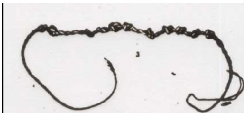
Figura 2 -Dibujo de un Wekui (contador a base de nudos) hallado por Theodor Koch-Grümberg en el sur de Venezuela, con motivo de su expedición etnográfica en 1911.

Uno de los problemas que se nos presentaba, era determinar si alguna etnia utilizaba algún instrumento para contar el tiempo, o cualquier cosa. Ello nos llevó a indagar en la obra extensa de Theodor Koch-Grümberg quien había estado en Venezuela entre 1911-1913 y como buen etnógrafo no solamente fotografió parte de los acontecimientos de su viaje, sino que dibujó variados objetos de uso entre los indígenas de la región sur de Venezuela. Hallamos efectivamente un dibujo de un wekui y su descripción. En efecto, en un trabajo de Fray Cesáreo de Armellada (1991), hallamos una referencia en el diccionario Pemón en la palabra Wekui . Se trataba de un instrumento hecho con hojas de palma tejidas y con nudos. Este instrumento es usado principalmente cuando alguien de la etnia viaja por cierto tiempo, y entonces hacen la cuenta con nudos, y luego, desatando un nudo por día, de los transcurridos, saben los faltantes para llegar al destino, o bien para el regreso a casa.