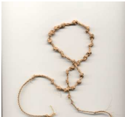
Figura 3- Wekui procedente de la comunidad de Wonken. Foto D Sánchez P - 1989

Además de los wekui que hemos mostrado, tenemos referencias de que tanto los Pemon como los Wo'tuja, utilizaban también, palos con muescas para contar, (llamados Vekui en Pemon) pero lamentablemente no hemos podido hallar ningún ejemplar. En el caso de los Wo'tuja el instrumento descrito se llama dau isodana pajatu roropu . Sin embargo, es posible que algunas otras etnias posean o hayan tenido instrumentos con la misma función, pero tampoco hemos podido hallar, hasta ahora, ninguna referencia sobre ellos.