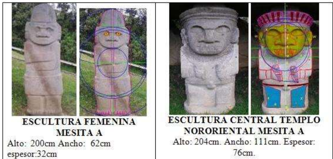
Figura 1: Visualización de regiones representativas en algunas estatuas de San Agustín

Las dimensiones que se muestran en la figura 1, fueron tomadas de Sotomayor y Uribe (1987).