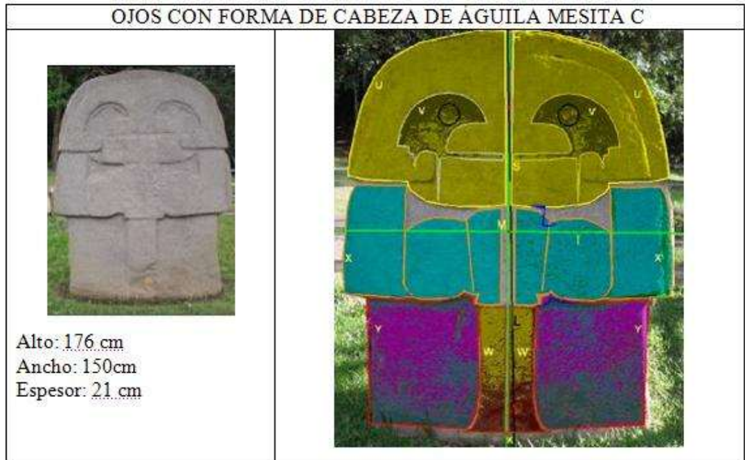
Figura 4: Escultura Ojos Cabeza de Águila

Los trazos en esta escultura se inician con la recta S , la cual se superpone sobre una recta tallada en la escultura. De la misma manera se construye la recta L .