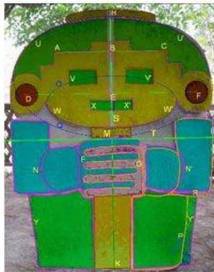
Figura 2: Visualización de elementos trazados con Cabri.