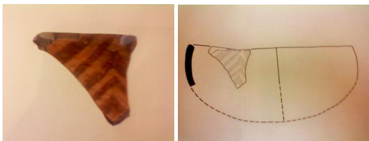
Figura 7. Fragmento de cerámica precolombina que data aproximadamente del año 1000 A.C. encontrada en cercanías del municipio de Guacamayas, donde está presente el diseño llamado en “M”.

espiral y las franjas ascendentes y descendentes) los cuales están presentes tanto en los diseños en las cerámicas como actualmente en las artesanías que elabora la comunidad de artesanos, a continuación se presentará un fragmento de cerámica con una serie de franjas ascendentes y descendentes y la reconstrucción del objeto que propone la autora.