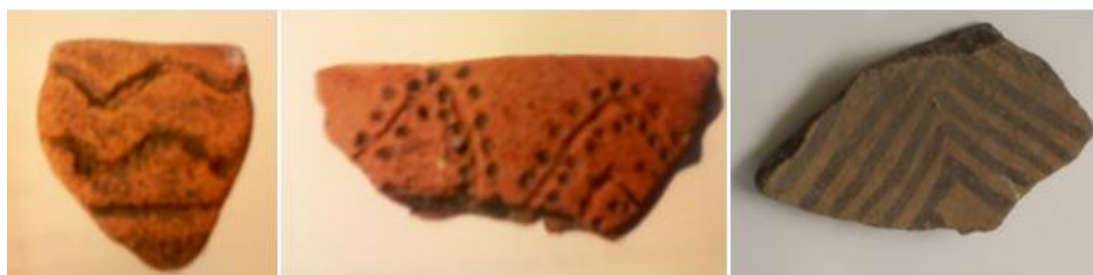
Figura 8. Algunos fragmentos de cerámica encontrados en la excavación arqueológica por Ann Onbosrn en el año de 1992, donde también está presente el diseño que actualmente siguen los artesanos del municipio de Guacamayas.

Continuación se mostrarán más cerámicas con las mismas características: