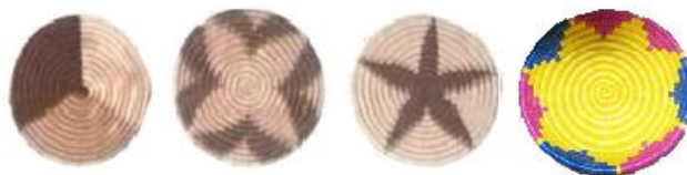
Figura 3. Divisiones de la circunferencia para n = 3,4,5,7

Las divisiones de circunferencias: un tipo de diseño muy peculiar, donde se puede evidenciar la habilidad para dividir la circunferencia, la cual no está basada en un sistema sexagesimal de 360 grados. En Fuentes (2011), se presenta la estrategia que siguen los artesanos para hacer las divisiones de una determinada longitud, que a su vez son utilizados para las divisiones de las circunferencias en la elaboración de individuales en paja y fique.