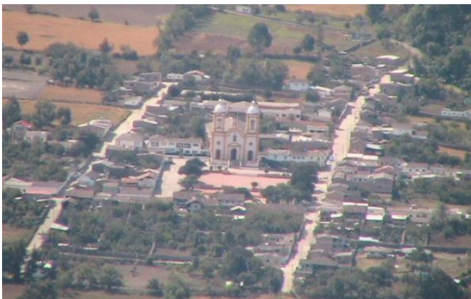
Figura 1. Casco urbano del municipio de Guacamayas, Boyacá, Colombia.

Actualmente, el municipio cuenta con casi 2000 habitantes, la mayor parte en la zona rural, la comunidad dedica su tiempo a las labores agropecuarias y la creación de artesanías; esta comunidad como todos los campesinos Colombianos, son personas amables, sencillas, tranquilas, humildes, bondadosas y sobre todo muy trabajadoras, que lamentablemente han padecido en carne propia los resultados del conflicto armado interno 9 que ha sufrido Colombia por más de cincuenta (50) años; aún así en medio de tanta violencia y pobreza, la comunidad Guacamayas y el norte del departamento de Boyacá, es resistente, valiente y digna, no da su brazo a torcer, enfrentan con coraje las problemáticas que los afectan.