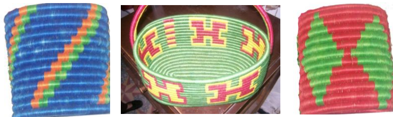
Figura 5. Algunos ejemplos de objetos donde se observan frisos caracterizados un grupo de translaciones.

Friso conformado por translaciones: la translación es el movimiento rígido en el plano más usual en los diseños de la comunidad, a continuación se presentarán algunos frisos donde se pueden observar las translaciones de una determinada figura.