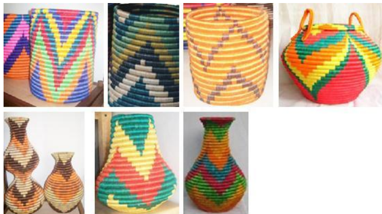
Figura 6. Algunos ejemplos de objetos donde está presente el diseño con franjas ascendentes y descendentes.

Friso zing zang: es un diseño tipo friso muy peculiar. Este diseño se caracteriza por la utilización de franjas ascendentes y descendentes, los artesanos lo llaman diseño en “M”, a continuación se presentarán algunos objetos que tienen este diseño.