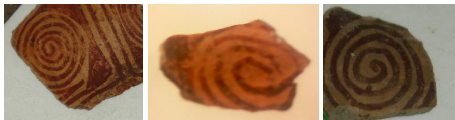
Figura 9. Algunos fragmentos de cerámica encontrados en la excavación arqueológica por Ann Onbosrn en el año de 1992, donde está presente la representación de la espiral como elemento significativo de sus diseños, además está aún pervive en los diseños de los artesanos del municipio de Guacamayas.

Fuentes, C. (2012). La Etnomatemática como mediadora en los procesos de la reconstrucción de la historia de los pueblos, el caso de los artesanos del municipio de Guacamayas en Boyacá, Colombia. Revista Latinoamericana de Etnomatemática , 5(2), 66-79.