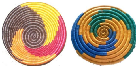
Figura 2. Ejemplo de diseño en espiral, presente en las artesanías del grupo A.

Fuentes, C. (2012). La Etnomatemática como mediadora en los procesos de la reconstrucción de la historia de los pueblos, el caso de los artesanos del municipio de Guacamayas en Boyacá, Colombia. Revista Latinoamericana de Etnomatemática , 5(2), 66-79.