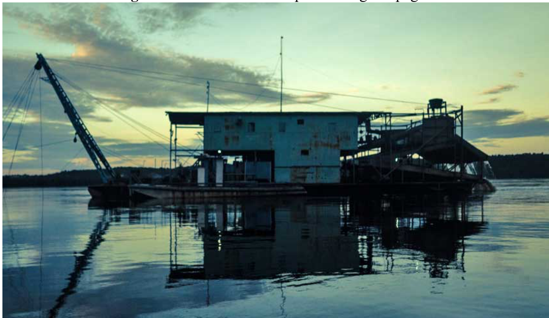
Figura 3 - Balsas usadas na prática da garimpagem