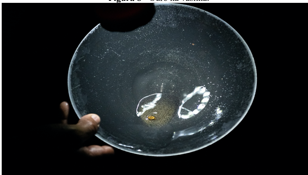
Figura 8 - Ouro na vasilha.