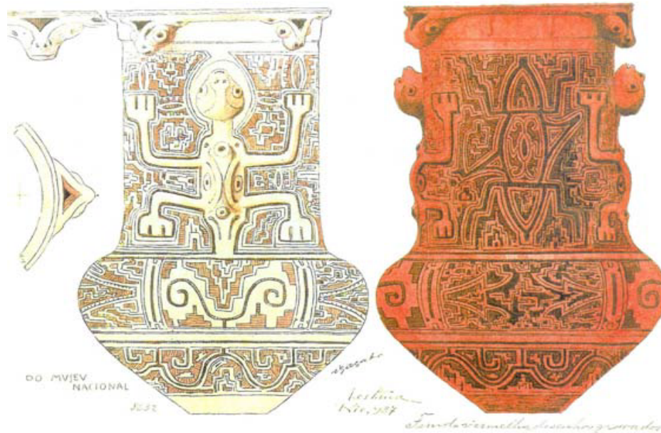
Figura 1 – Urna funerária marajoara.

Não pense, veja! 7 O que Viana vê nas urnas funerárias marajoaras da Figura 1? O que ele vê são padrões simétricos idênticos aos das calçadas portuguesas e aos das cerâmicas mesopotâmicas.