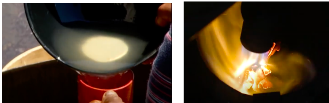
Figuras 6 e 7 - Processo de aderência ao mercúrio à esquerda e a volatilização do mercúrio à direita.