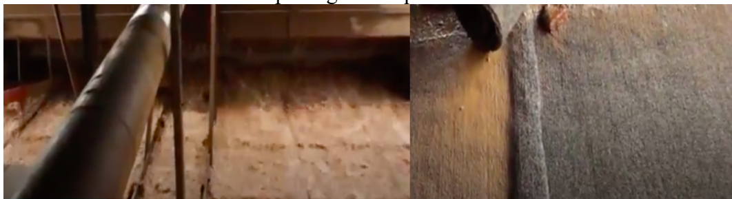
Figura 4 - À esquerda, cascata artificial formada pelos sedimentos pesados extraídos do rio. À direita tapetes grossos que retêm areia e ouro.