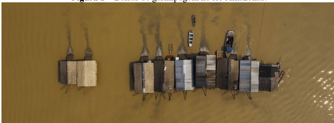
Figura 2 – Balsas de garimpagem no rio Amazonas.