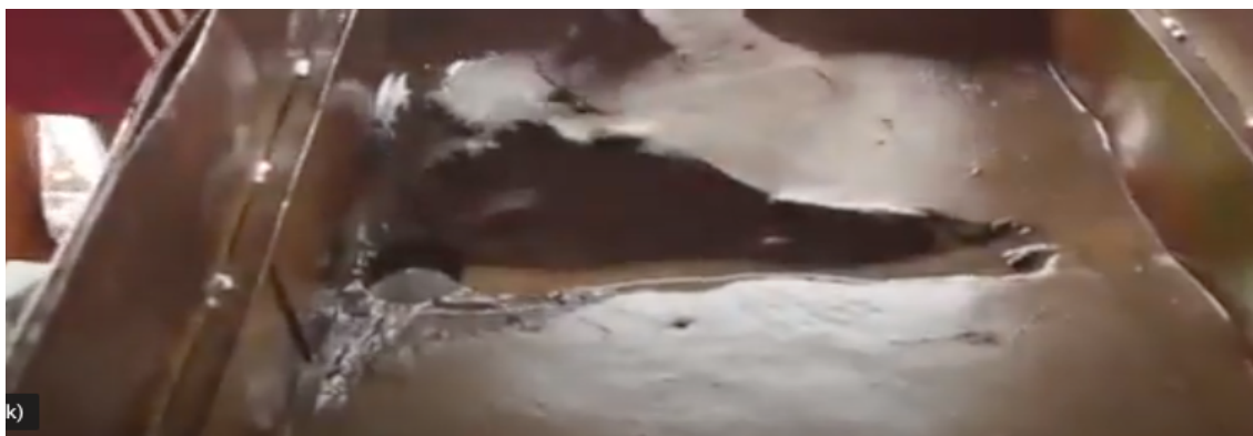
Figura 5 - Tanque de separação do material arenoso da água.