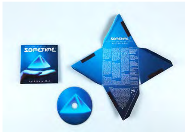
Figura 2. Empaque del CD que se diseña [6]

En la Figura 2 se presenta el empaque de un CD que se diseña para un grupo de música electrónica [6], una situación es similar a la que se propone en este capítulo.