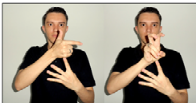
Figura 04: Composição do número que representa a quarta moeda de 25 centavos