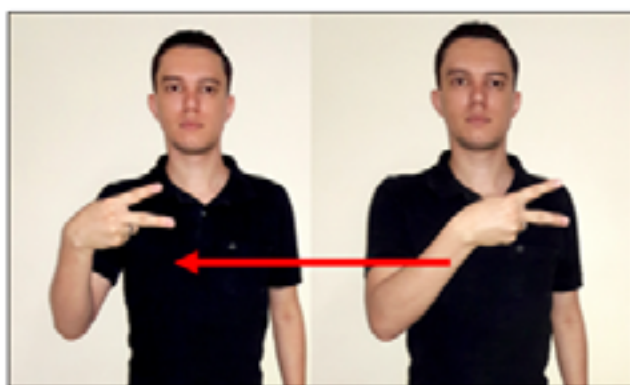
Figura 15: Sinal utilizado pelo participante B23 para representar a igualdade em uma equação, expressão numérica ou na comparação entre dois números