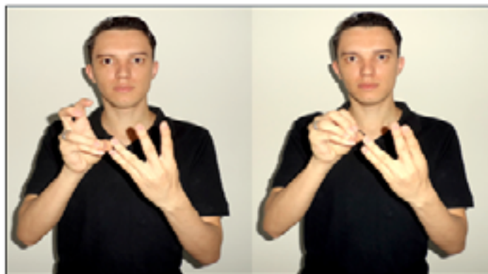
Figura 06: Representação da soma das primeira moeda e da segunda moeda de 25 centavos