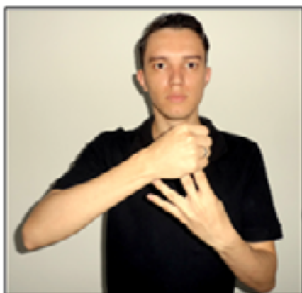
Figura 07: Representação da junção da terceira moeda e da quarta moeda de 25 centavos