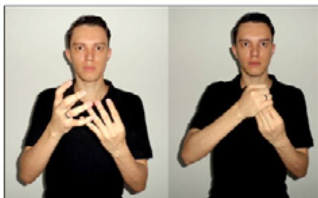
Figura 09: Representação da soma das quatro moedas de 25 centavos