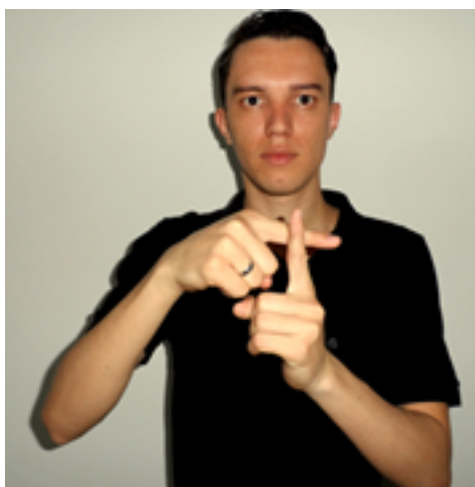
Figura 12: Representação da palavra soma