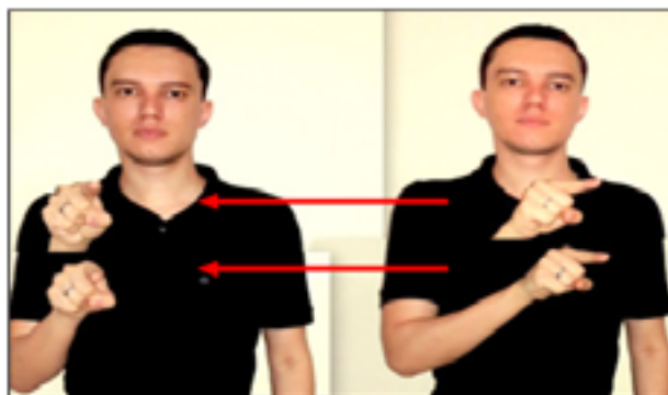
Figura 16: Sinal utilizado pelos participantes A1 e A13 para representar a igualdade em uma equação, expressão numérica ou na comparação entre dois números