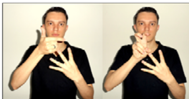
Figura 03: Composição do número que representa a terceira moeda de 25 centavos