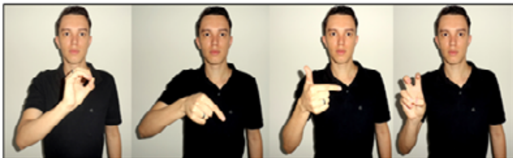
Figura 11: Representação do valor R$ 0,25