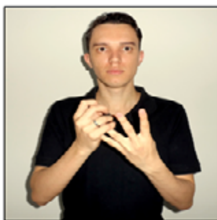
Figura 05: Representação da junção da primeira moeda e da segunda moeda de 25 centavos