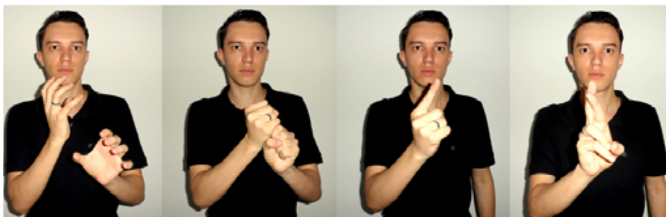
Figura 13: Representação do resultado 1 real