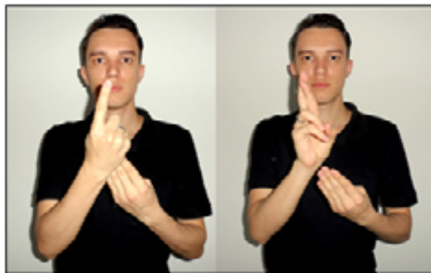
Figura 10: Representação do valor de 1 real