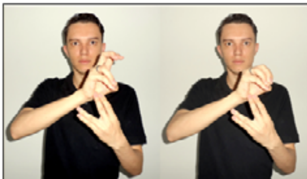
Figura 08: Representação da soma da terceira e quarta moedas de 25 centavos