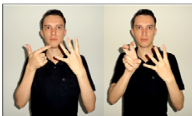
Figura 01: Composição do número que representa a primeira moeda de 25 centavos