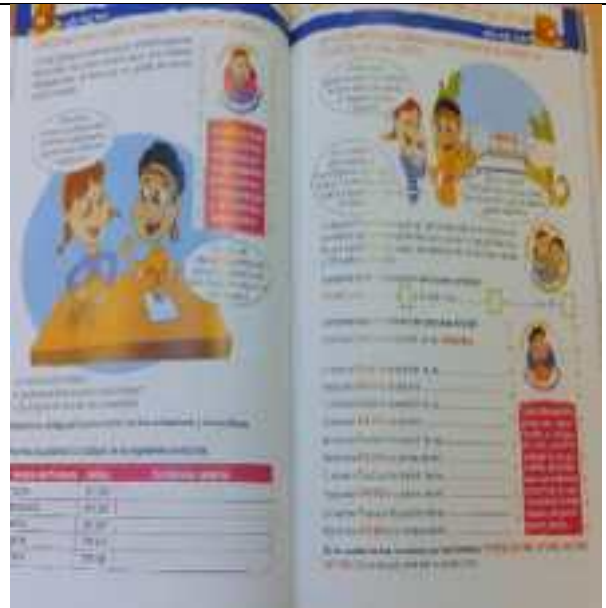
Figura 4: página 97