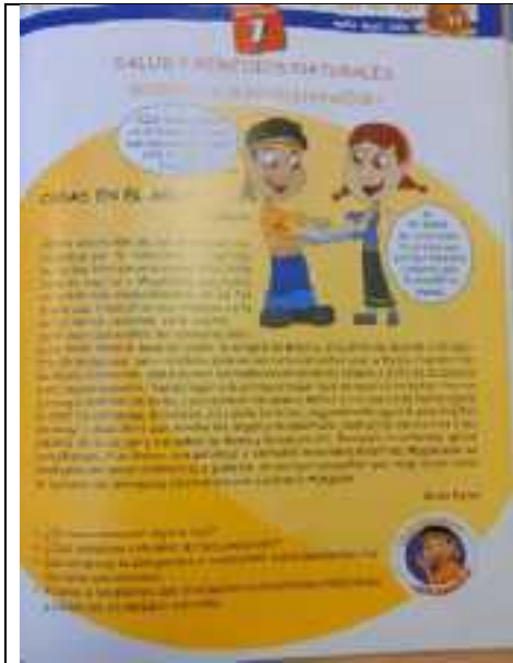
Figura 3: página 93