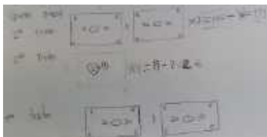
Figura 3. Representación pictórica Grupo E.

La representación pictórica se identificó siempre que se hizo uso de los dibujos para representar la variable. Esta última únicamente se identificó en un caso, que se puede ver en la Figura 3.