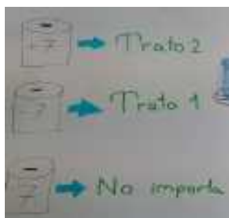
Figura 2. Representación simbólica Grupo D

La representación simbólica se identificó siempre que se hizo uso de letras o símbolos para representar la variable, como se puede ver en la Figura 2.