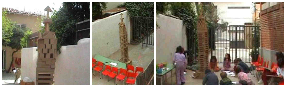
Figura 20. La torre terminada con sus últimos detalles