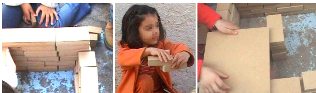
Figura 17. Durante la construcción, surgen problemas con los que no nos habíamos encontrado antes

Después de darle vueltas, deciden poner un pilar en el centro para que no se caiga. El problema planteado era totalmente nuevo; no había surgido en la visita del experto. Sin embargo, los niños fueron capaces, no sólo de aplicar los aprendizajes adquiridos, sino de buscar soluciones nuevas y creativas a problemas que no pertenecían al repertorio de su experiencia anterior. Al final de esta etapa, la base de la torre está asentada y el grupo ha conseguido crear un ambiente de trabajo en el que todos participarán y construirán juntos la torre. La base de la torre es más ancha de lo que hasta entonces habían trabajado. También se han ensanchado los lazos que unen al grupo, produciéndose un salto cualitativo en las relaciones personales. Han necesitado hora y media para llegar aquí. La base no levanta más de 20 centímetros, pero es sólida para construir sobre ella. Desde este momento, todo será