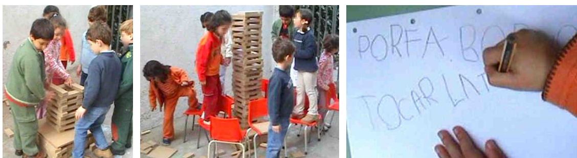
Figura 18. Se aplican distintas técnicas para la construcción y se sube a las sillas para ganar altura