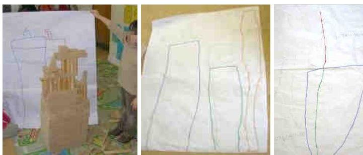
Figura 9. Los registros de las tres torres. A la izquierda más baja y en el centro y la derecha, más altas

muchos; luego, sólo cinco. Pero todo se les acaba cayendo y con mucha más facilidad que cuando ponían sólo cuatro pilares. Proponen pegar los pilares a la tabla, pero esta solución no es válida en el planteamiento de la experiencia, ya que el material debía de quedar intacto al finalizar cada sesión. De esta manera, los integrantes del grupo cambian de estrategia. Utilizan la misma estrategia que los otros dos grupos (Figura 8, derecha). Cuando ya no quedan piezas planas, los cilindros se emplean para decorar la torre y, de paso, para ganar un poco más de altura. Después deben comparar el resultado con las torres anteriores. La torre, gracias a los cilindros, es mucho más alta que las otras dos. Al mostrar el resultado a la maestra (Figura 9, derecha) le dicen: «Es la línea roja». Al solicitarles aclaraciones, en el grupo responden: «No sólo la línea roja, sino que desde abajo hasta la línea roja».