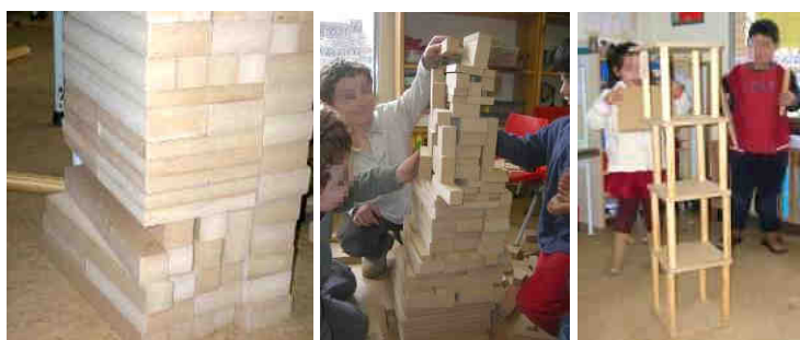
Figura 5. Las tres nuevas construcciones