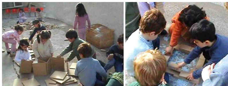
Figura 16. Se prueban distintos procedimientos para formar la base de la torre

Subirse en una silla o en una mesa es muy divertido en estas edades y hacerlo con consentimiento adulto, casi por obligación, es aún más divertido. Nada más empezar, surgen los primeros problemas de construcción de la base de la torre y, análogamente, aparecen las primeras dificultades en el grupo. Tienen que decidir dónde van a empezar la torre.