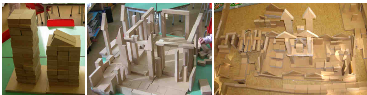
Figura 2. Construcciones realizadas en situaciones de juego libre (cuarta sesión)

Durante el juego libre, niños y niñas forman pequeños grupos que unen, separan y rehacen varias veces, incluso dentro de una misma sesión. Hay también niños que juegan individualmente al principio y luego se integran en un grupo; otros juegan individualmente durante toda la sesión. Este tipo de propuestas, a través del juego, sirve a los niños para desarrollarse de forma autónoma; a los maestros les da pautas para comprender comportamientos y situaciones que se dan luego en el trabajo en pequeño grupo. Este trabajo nos permite incidir en las adquisiciones infantiles en los ámbitos emocional y social, que se desarrollan con estos tipos de metodologías. Concebimos la vida del aula como algo complejo, que implica aspectos cognitivos y relativos a contenidos curriculares (aquí resaltamos los matemáticos), pero también a la esfera de lo afectivo. Los maestros debemos crear espacios para que todos estos afectos y emociones, que niñas y niños deben aprender a manejar, afloren y se espongan; así podrán aprender a identificarlos y, con el tiempo, alcanzar cierto control sobre los mismos.