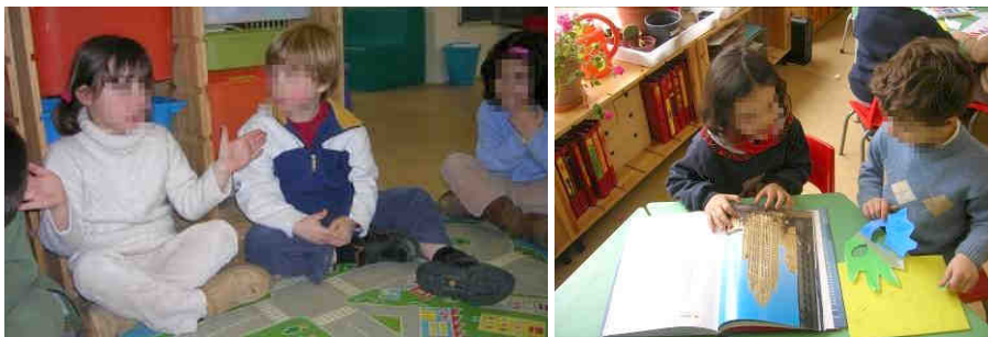
Figura 7. Dos momentos fundamentales: la discusión y la documentación

A lo largo de estas conversaciones surge la idea de que van a construir una torre tan alta que no les va a caber dentro de la clase. Y eso lo expresan como una dificultad para continuar con su trabajo. La maestra les tranquiliza prometiéndoles que si eso ocurriera, bajarían al patio para seguir construyendo sin que el techo les limite. En este momento la actividad da un giro. Los niños ya no están motivados por construir una torre más alta que la anterior. Desean, sobre todo, conseguir construir torres tan altas que sea necesario hacerlas en el patio del colegio.