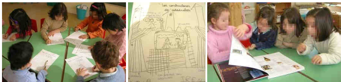
Figura 10. Cada niño elabora su dibujo y se consultan libros de arquitectura