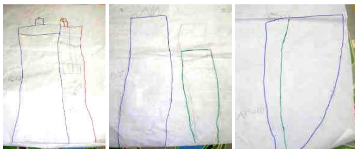
Figura 6. Los registros de altura de las tres torres junto con los del día anterior