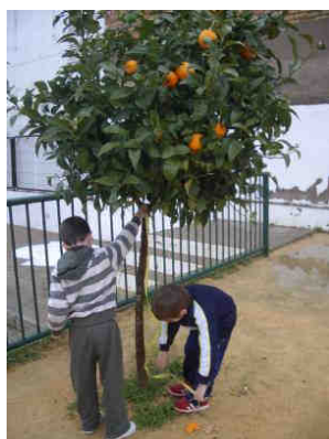
Figura 2. Los alumnos miden la altura de un árbol con la cinta métrica