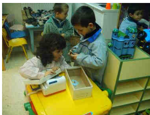
Figura 4. Compra-venta de zapatos

Durante el juego realizaron múltiples actividades: simbolizaron (vendiendo, probándose, comprando, desfilando), tuvieron cuidado de cobrar el precio justo, hicieron listas de compras, leyeron marcas de zapatos, etc. Y para finalizar se hizo un diálogo sobre lo que habían vivido y aprendido; representaron la zapatería en el papel; se proyectaron fotos; y se hizo una exposición para que las familias pudieran ver todo el trabajo que habían realizado los alumnos.