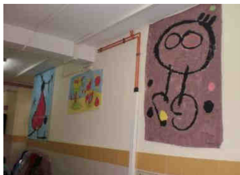
Figura 7. Las reproducciones a tamaño real

El mayor reto surgió cuando debieron colocar los cuadros en la pared: en primer lugar, buscaron un espacio adecuado en el pasillo, ya que algunas de las pinturas eran de gran tamaño y no cabían en cualquier sitio. Cuando ya tuvieron clara la ubicación, colgaron los cuadros en la pared y se dejaron expuestos para que los alumnos pudieran observarlos cuando les apeteciera, dialogar sobre ellos, etc. Finalmente, todo el trabajo realizado se recopiló en un libro que cada alumno se llevó a casa para compartirlo con sus familias.