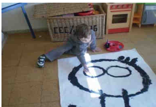
Figura 6. Reproduciendo “Autorretrato”

Una vez descritas las pinturas en la plantilla, se clasificaron según criterios diversos (cualitativos, cuantitativos y geométricos), verbalizando los criterios utilizados. Así, por ejemplo, hay alumnos que los clasificaron por el color predominante, otros por las formas, etc. Finalmente se realizó un trabajo de medida que consistió en buscar información sobre las dimensiones reales de los cuadros, reproducirlos a tamaño real y buscar un espacio adecuado para colgarlos. En el aula se estableció un diálogo para decidir qué instrumento debía usarse para dibujar las medidas reales de las pinturas en el papel, y todos los alumnos estuvieron de acuerdo en utilizar una cinta métrica. Con la ayuda de las maestras dibujaron los cuadros y los pintaron entre todos.