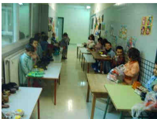
Figura 3. Las tiendas de zapatos

La distribución del espacio siguió diversas fases: en primer lugar pensaron cómo organizar la zapatería. La idea que surgió fue clasificar los zapatos por grupos en varios mostradores. Después, eligieron los materiales para montar la zapatería y discutieron cómo hacer el dinero y los carteles de los precios, aprovechando materiales reciclados que suelen traer a clase. Conversaron sobre la procedencia del dinero y crearon un banco para repartirlo. Al preparar el espacio pusieron en práctica conocimientos relativos a la posición (dónde colocar los mostradores) y la medida (lo que ocupan los mostradores). Cuando ya tuvieron clara la ubicación y la distribución de los mostradores reunieron todos los zapatos (que estaban mezclados) y empezaron a formar parejas. Fueron colocando los zapatos en los diferentes mostradores según criterios diversos (el color, el tamaño, el tipo de zapatos, etc.). Con los mostradores montados, etiquetaron el precio de los zapatos y después invitaron a los alumnos de otra clase a comprar zapatos con el dinero de cartón sobrante de la fiesta de la Ikastola .