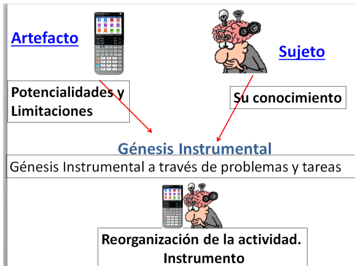
Figura 1. Esquema del proceso de génesis instrumental.