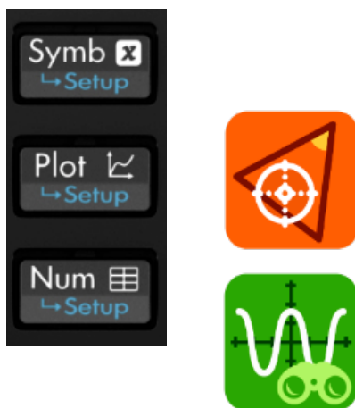
Figura 2. Esquema de vinculación entre las herramientas de representación y las aplicaciones del dispositivo.

Por ejemplo, sin mayores técnicas instrumentadas un alumno podrá explorar en cada aplicación diferentes representaciones de un mismo objeto matemático a través de la terna de herramientas, SYMB, PLOT y NUM, en cualquier aplicación (ver figura 2)