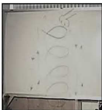
Figura 2: Dibujo de resorte

Esta figura (Figura 2) es lo que uno de los ciudadanos-participantes respondió ande la situación. Para él tiene sentido y le permite explicar el fenómeno del resorte. Al preguntarle ¿qué significan las rayas alrededor?, él responde: “... pues que se está moviendo ”. Posteriormente al cuestionarle sobre el tiempo en que tarda en detenerse el resorte y cómo se encuentra expresado en el dibujo, la respuesta es: “ ocho segundos ” y dos justificaciones que se obtuvieron fueron: “ porque rebota 8 veces ”, “ porque tienen 8 flechas ”. Haciendo referencia a las flechas para arriba y para abajo que tiene el dibujo en los lados.