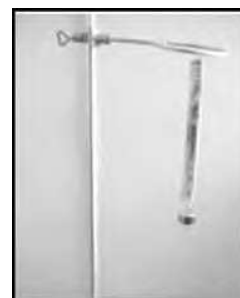
Figura 1: Resorte con pesa

Ante la indicación de dibujar el movimiento de un resorte al colocarse una pesa, ¿qué tipo de respuesta se recibe?, ¿cómo sería este dibujo? (ver Figura 1) Seguramente la respuesta hará uso de algunos términos como funciones, gráficas, tal vez un poco de álgebra, ciertas definiciones, incluso se podría hablar de geometría o