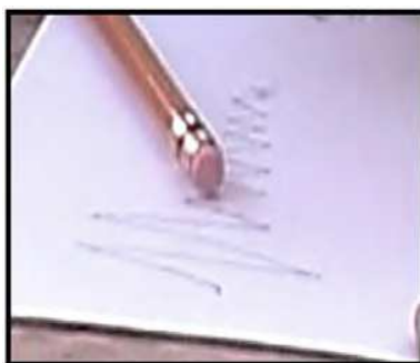
Figura 4: Dibujo de resorte 3

Un tercer ejemplo, es el que nos puede parecer que se acerca más a la situación que se pretende representar, (ver Figura 4).