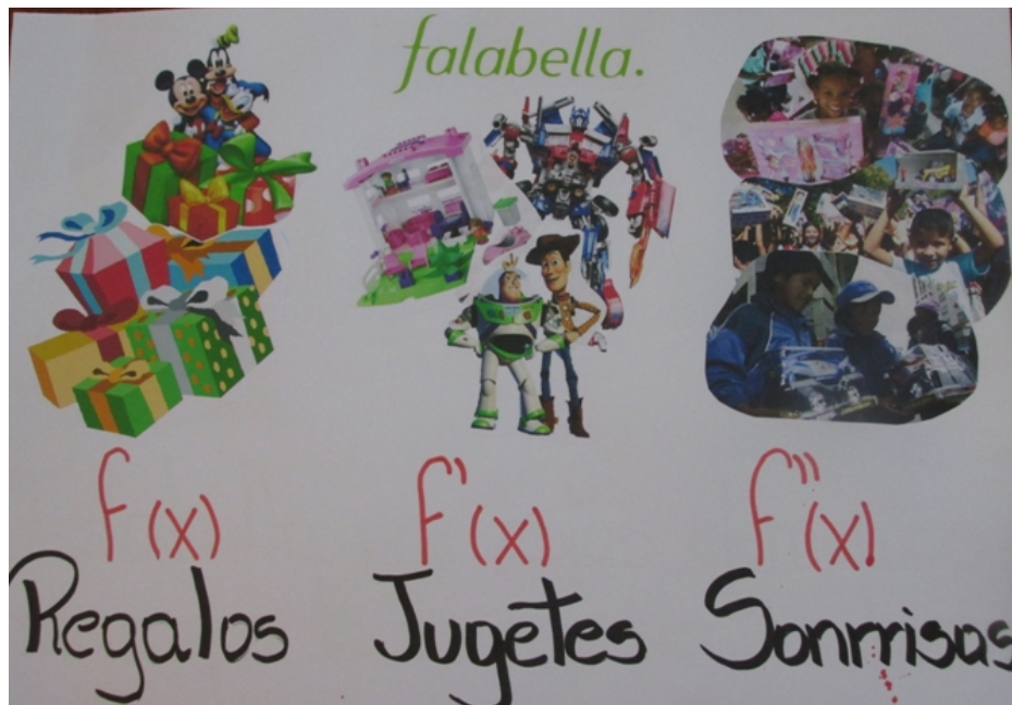
Figura 10. Publicidad con elementos de matemática avanzada