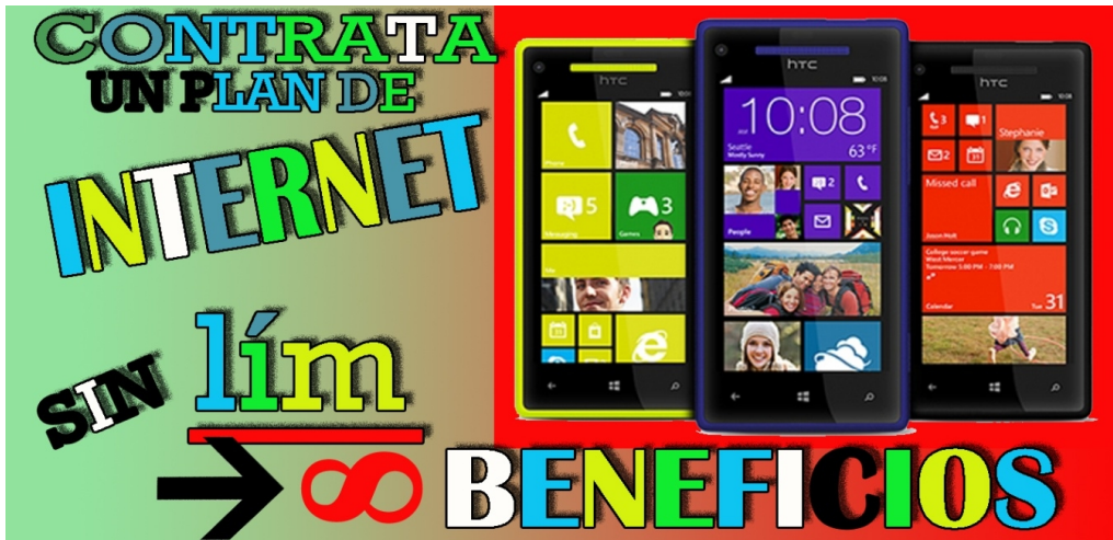
Figura 8. Publicidad con elementos de matemática avanzada