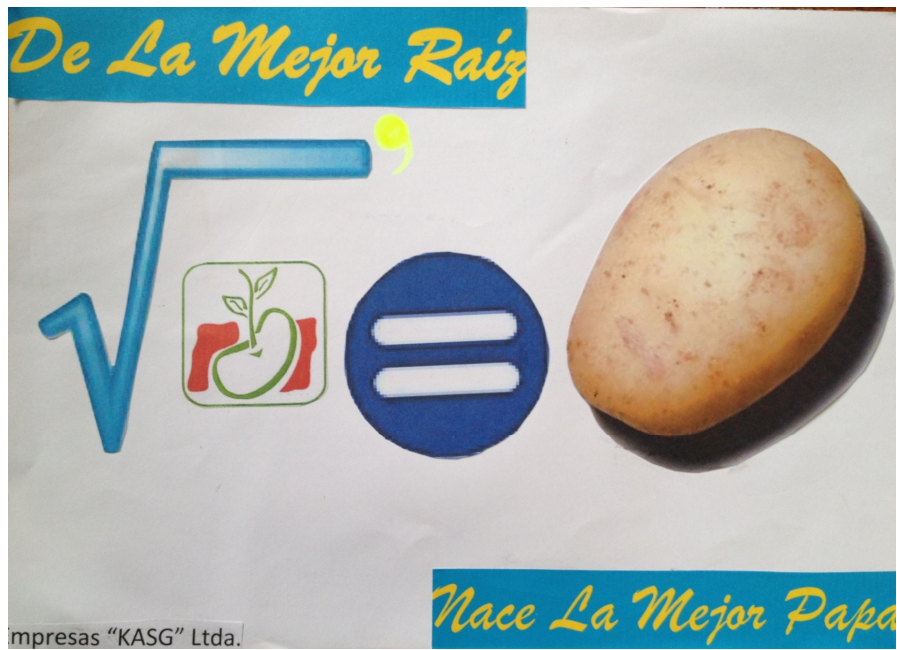
Figura 7. Publicidad de empresa Kast Ltda. con elementos de matemática avanzada