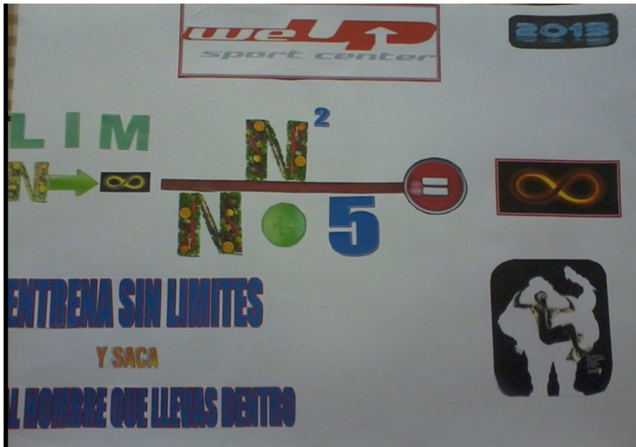
Figura 9. Publicidad del gimnasio We – Up con elementos de matemática avanzada