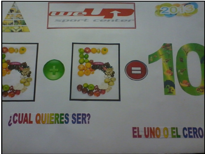
Figura 5. Publicidad del gimnasio We – Up con elementos de matemática básica

La suma de 5+5=10 , ¿Cuál quieres ser? El uno o el cero... hacen referencia a que el 1 es una persona delgada y que el 0 es una persona más corpulenta. Con este afiche publicitario se busca que las personas tomen conciencia y asistan al gimnasio We-Up , manteniendo una vida sana.