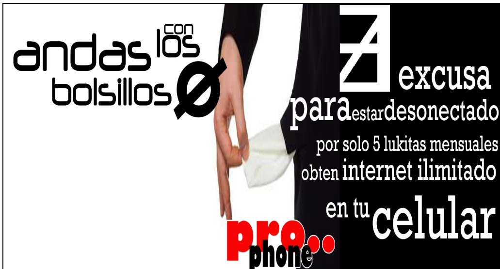
Figura 6. Publicidad empresa telefónica Pro..phone con elementos de matemática básica