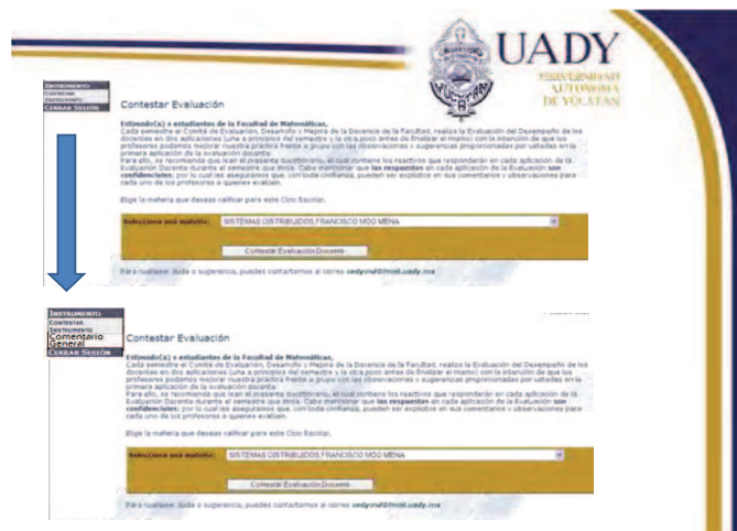
Figura 1. Sistema de Evaluación Docente en línea

Actualmente, en la Facultad de Matemáticas de la UADY, se cuenta con el Sistema de Evaluación Docente (SED) en línea (Figura 1).