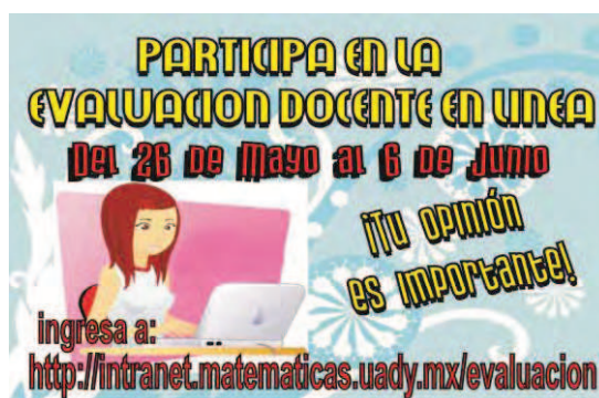
Figura 5. Cartel de promoción de la Evaluación Docente en línea

Posteriormente al período de aplicación del SED en línea, se les exhorta a los profesores a revisar sus reportes a través del sistema en línea, a reflexionar acerca de sus fortalezas y áreas de oportunidad para mejorar su práctica docente frente a grupo y a realizar la retroalimentación correspondiente con cada uno de los grupos a su cargo. Además, se les solicita realizar una actividad de retroalimentación de sus resultados de la evaluación docente al interior de los cuerpos académicos y entregar a secretaría académica un reporte de dicha actividad. Todo lo anterior, con la intención de promover la realización, de alguna manera, de los tres tipos básicos de evaluación: autoevaluación, coevaluación y la evaluación mutua, de acuerdo a los lineamientos que establece la evaluación formativa (Díaz-Barriga y Hernández, 2002).