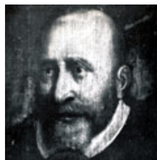
Robert Recorde (1510–1558)

En este momento histórico al que nos estamos refiriendo surge el signo “=”, uno de los símbolos matemáticos que ha sido adoptado de manera universal y, según Wheeler (1981), uno de los que ha sufrido en mayor medida de un mal uso a lo largo de su evolución. Como la mayoría de los símbolos de la aritmética tuvo un origen algebraico. El primer uso de este signo se le adjudica a Robert Recorde; el matemático de mayor importancia en la Inglaterra del siglo XVI (Boyer, 1986). No obstante, Cajori (1993) reconoce la existencia de un matemático en Bolonia que empleó el mismo signo en sus manuscritos, fechados, probablemente, entre 1550 y 1568.