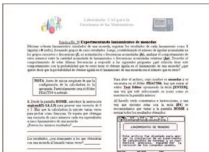
Vista parcial hoja de trabajo de la actividad “Simulación del lanzamiento de monedas.”

El desarrollo de la actividad contempla diferentes momentos como son: la reflexión preliminar y establecimiento de creencias; abordamiento físico de la situación a través del lanzamiento de una moneda real y análisis individual, sustitución de dispositivos físicos por virtuales mediante la simulación de lanzamientos de monedas en calculadora y análisis individual, para concluir con la comparación colectiva tanto de resultados como de análisis realizados.