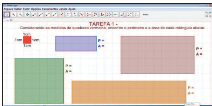
Figura 1: Tarefa geométrica elaborada no software Geogebra.

Por falta de maior espaço, apresentamos, a seguir, apenas duas das tarefas que elaboramos no PIBID/UFJF e discutimos em nossa oficina na 27ª RELME.