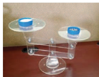
Figura 3: Balanza concreta para ecuaciones lineales

En un segundo momento se trabaja con la balanza simulada, véase Figura 4, utilizando las características dinámicas del GeoGebra.