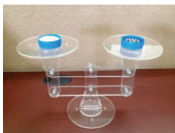
Figura 2: Balanza concreta para ecuaciones lineales

En un primer momento los estudiantes manipulan la balanza concreta, las figuras 2 y 3 ilustran la balanza concreta para ecuaciones lineales; en la figura 2 muestra a la balanza en equilibrio (refleja la misma cantidad de canicas en ambos lados de los platillos), mientras que en la figura 3 se ve representado el desequilibrio.