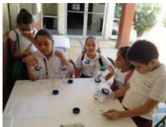
Figura 1: Estudiantes manipulando balanzas concretas

lado, tiene que realizar lo mismo del otro lado. En la figura 1, se muestra a estudiantes manipulando las balanzas concretas.