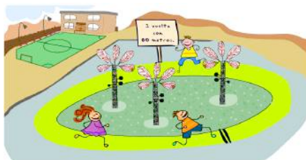
Figura 1. Imagen utilizada en la primera tarea

La figura propuesta 2 a los estudiantes para que inventen el problema es la siguiente: