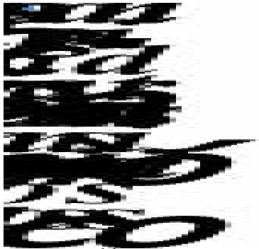
Figura 1: Enfoque Onto-Semiótico del Conocimiento y la Instrucción Matemática (EOS)

Se presenta, así, a continuación el enfoque 4 base para llevar a cabo la investigación, que se utiliza como referente base para realizar el análisis y caracterización la evaluación de los significados personales en una secuencia de actividades.