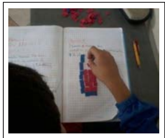
Figura 1. Estudiante construyendo un rectángulo de base 3 cm y altura 10 cm.