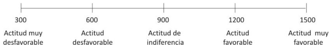
Escala Likert de valoración para medir la actitud de los estudiantes frente a las habilidades de desarrollo de un problema matemático

Como se puede observar en la figura 4 -12, el valor de la puntuación general correspondiente a 1169, esta en el intervalo 900 _ 1200, por lo que se puede concluir que el uso de heurísticas en el planteo y desarrollo de problemas matemáticos para los estudiantes de la muestra representa una actitud de indiferencia con alta tendencia a una actitud favorable.