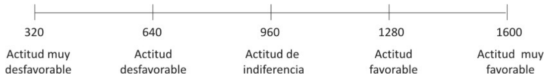
Escala Likert de valoración para medir la actitud de los estudiantes frente a las habilidades de planteo y comprensión de un problema matemático 1

Como se puede observar en la figura 4 – 11, el valor de la puntuación general correspondiente a 1281, esta en el intervalo 1280 _ 1660, por lo que se puede concluir que el uso de los mapas mentales en el planteo y comprensión de los problemas matemáticos para los estudiantes de la muestra representa una actitud favorable, con tendencia a muy favorable.