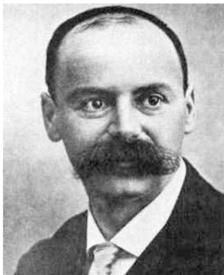
Figura 1.3 Karl Schwarzschild

No entraña dificultad alguna el cálculo de los coeficientes métricos relativistas en el caso más simple de un campo gravitacional con simetría esférica, de forma no rigurosa. Dada la estrecha relación que la Relatividad General establece entre la geometría espaciotemporal y los fenómenos físicos, deduciremos el valor de tales coeficientes figurándonos el comportamiento de un reloj y de una regla sometidos a la gravedad. El principio de Equivalencia, como su mismo nombre indica, equipara los efectos físicos de un sistema sin gravedad con los de otro que cae libremente en el seno de un campo gravitatorio. Por la misma razón resultarán equivalentes un campo gravitacional con aceleración g y un sistema no inercial con aceleración -g .