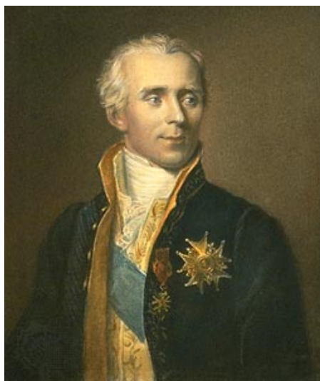
Figura 1.1 Pierre Simon, marqués de Laplace

Por ello, en matemáticas los armónicos esféricos son funciones armónicas que representan la variación espacial de un conjunto ortogonal de soluciones de la ecuación de Laplace cuando la solución se expresa en coordenadas esféricas. Estos armónicos son importantes en muchas aplicaciones teóricas y prácticas, particularmente en la teoría del potencial, que resulta relevante tanto para el campo gravitatorio como para la electrostática (incluso en los modelos atómicos sencillos).