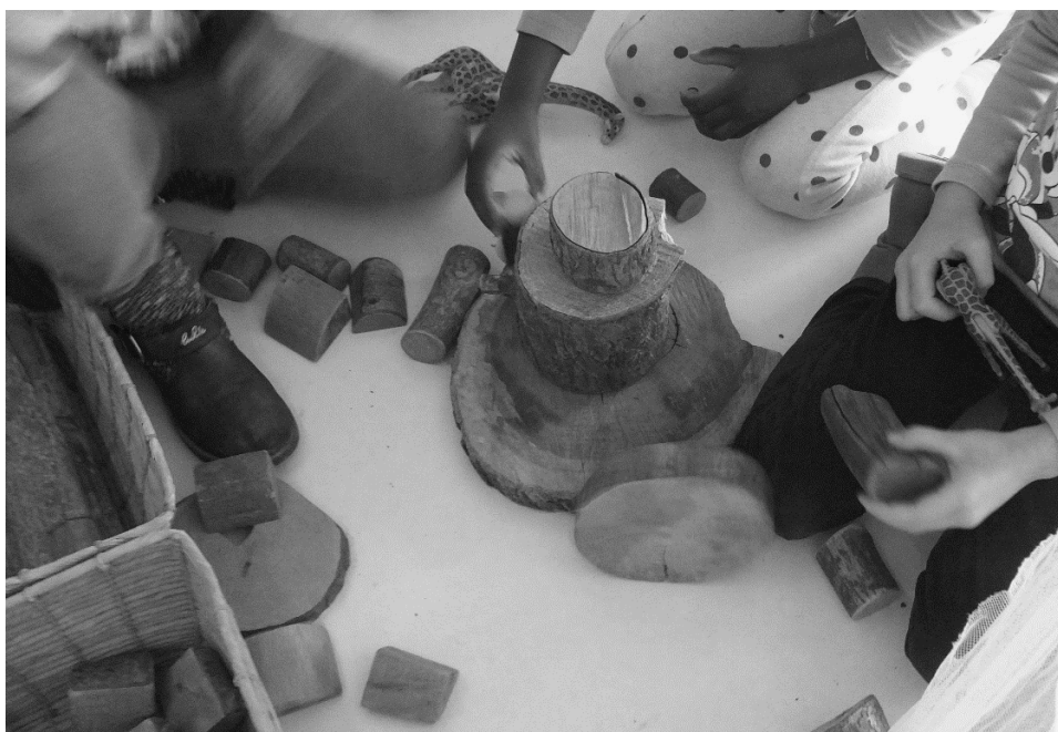
Figura 3. Juego libre en l'Escola dels Encants de Barcelona

En la Figura 3 mostramos a unas alumnas de educación infantil de l'Escola dels Encants de Barcelona realizando un juego libre, sin intervención de ningún adulto, en el que se puede apreciar una ordenación de piezas según tamaño.