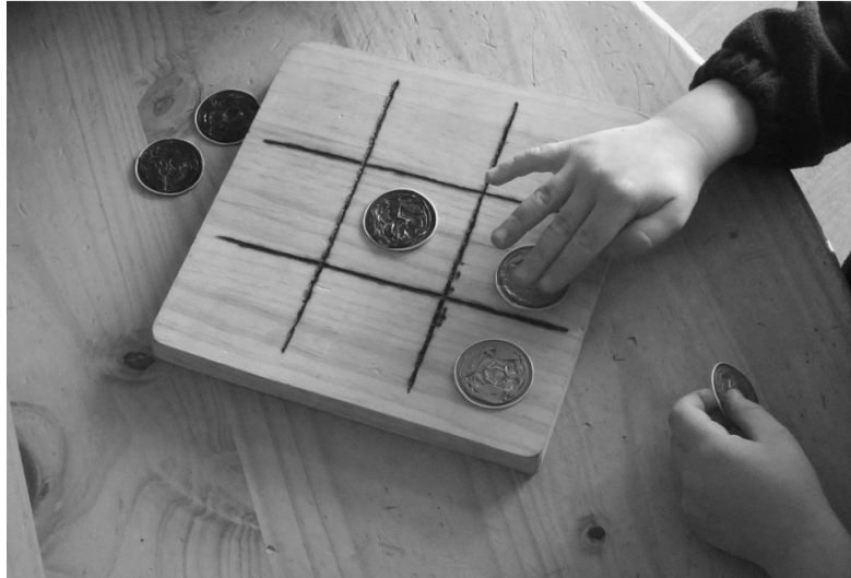
Figura 2. Juego con reglas en l'Escola dels Encants de Barcelona

El estudio de Schuler (2011) concluye que hay consenso en que los niños pequeños adquieren habilidades matemáticas principalmente de manera lúdica a través del juego libre, de ofertas abiertas y oportunidades de aprendizaje informales. En esencia, el juego puede ser visto, en su sentido más amplio, como la descripción de casi todas las actividades iniciadas espontáneamente por los niños pequeños. Siguiendo esta idea, en los últimos años, estudios empíricos han proporcionado pruebas de que los juegos matemáticamente ricos llegan a tener un impacto positivo en el aprendizaje matemático de los niños. Los juegos ricos matemáticamente ofrecen importantes contextos de aprendizaje informal que pueden ser utilizados como puntos de partida para el aprendizaje formal en la escuela primaria (Tubach, 2015).