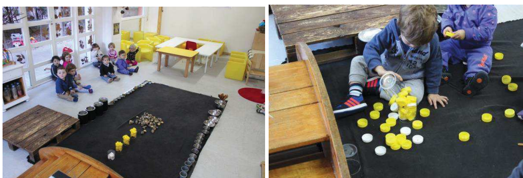
Figura 1. Juego heurístico en un aula de 1-2 años

Como vemos, hay una gran distancia entre los resultados obtenidos por la investigación psicológica sobre el pensamiento matemático siguiendo el modelo de habituación-deshabituación y las prácticas consideradas apropiadas para el ciclo de 0 a 3 años. Parece muy difícil establecer conexiones entre la teoría y la práctica; en particular, parece que los resultados de investigación tienen poco que aportar a las prácticas de aula, pero: ¿Tiene esto que ser forzosamente así? ¿Hay alternativas para conectar mejor resultados de investigación y práctica de aula?