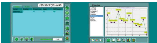
Estadísticas y calificaciones de usuario