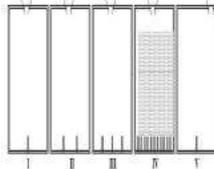
Figura 3. Dispositivo de Piaget para la enseñanza del concepto de distribución.

El aporte de Galton se utiliza para realizar una reflexión didáctica, sobre la enseñanza de la DN en la Educación Básica, considerándolo un recurso didáctico que facilite la comprensión de este concepto. Aunque en el MEN (2006) no aparece estipulado la enseñanza de la DN en la educación básica, no es razón suficiente para no introducirlo, ya que el mismo Piaget utiliza un dispositivo parecido al quincux, para la enseñanza del concepto de distribución en niños. Piaget usa 5 aparatos (Figura 3), de los cuales cuatro tienen la abertura superior en la parte central y uno la tiene en el extremo superior derecho. Los aparatos se diferencian por el número de ranuras que tienen en la parte inferior (2 ranuras en los dispositivos I y V, 3 en el II, 4 en el III y un gran número en el aparato IV). Se trata de introducir en cada una de ellos una bola, después una segunda y tercera, preguntando al niño donde cree que va a caer y por qué. Una vez comprendida la experiencia se pide al niño que explique la forma que tomaría la distribución cuando se deje caer un gran número de bolas. Finalmente se dejan caer las bolas y se pide al niño que interprete la distribución obtenida (Tauber, 2001).