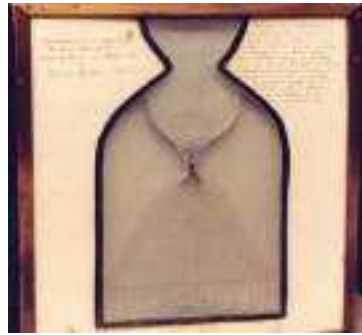
Figura 1. Imagen del quincux original, creado aparentemente por Galton en el año 1873.

la parte inferior, formando una superficie con forma de campana. Como aparece en la Figura 2.