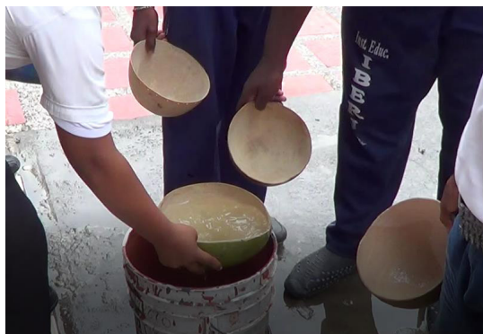
Fig. 1. Estudiantes llenando con agua calabazos

La maestra integró las etnomatemáticas propias de la cultura tumaqueña, haciendo uso de un microproyecto (Fernández-Oliveras & Oliveras, 2015), incluyendo una situación problema donde se utilizan medidas no convencionales usadas tradicionalmente por la comunidad. La consigna de la situación problema fue llenar con agua diferentes recipientes, calabazas y guaduas (Fig. 1), comparando cuántas caben en un cubo para afianzar conceptualmente la medida de la capacidad (Godino, 2004).