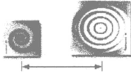
Figura 2.5. Distancia rectilínea entre centroides de dos departamentos (tomada de Martínez, 2002, p. 26).

problema, recurriendo a la distancia rectilínea entre sus centroides. Se presenta la siguiente figura: