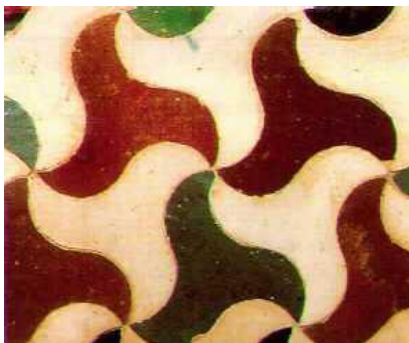
Figura 1. Tesela Nazarí Pajarita

Se realizará en primer lugar, la tesela de la pajarita (figura No.1), siendo esta una de las más sencillas, que parte de un triángulo equilátero y teniendo como base el punto medio de los lados, se hacen rotaciones de 180^\circ :