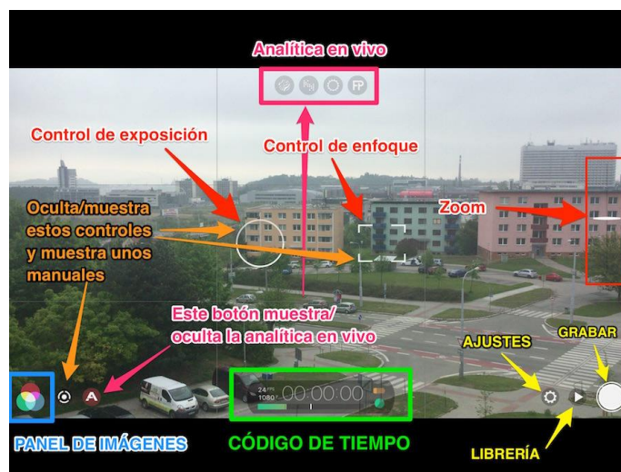
Ilustración 6, Filmicpro, https://limni.net/filmic-pro/