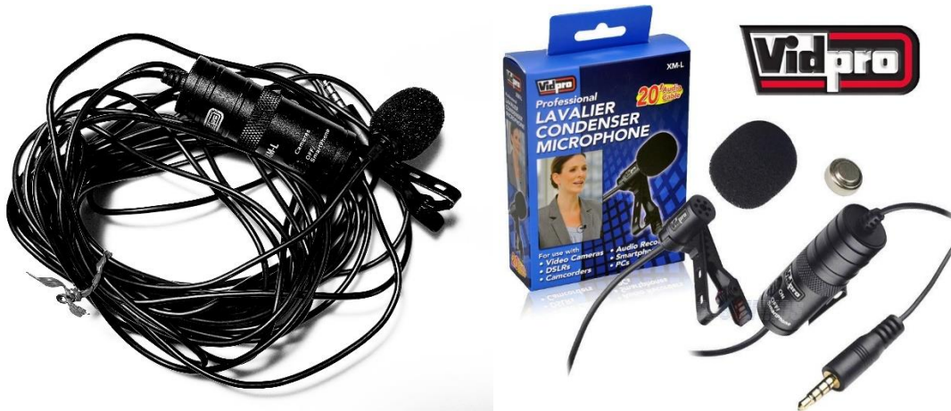
Ilustración 7, Micrófono Vidpro https://articulo.mercadolibre.com.co/MCO-505952554-microfono-de-solapa-lavalier-vidpro-xm-l-20-audio-cable- JM