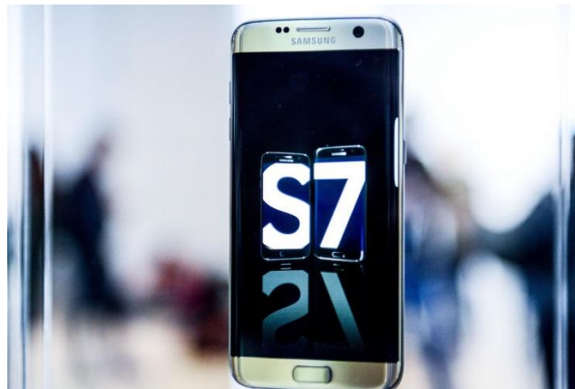
Ilustración 5, Samsung S7 https://www.vox.com/2016/3/14/11586938/samsungs-galaxy-s7-costs-at-least-255-to-build

12 MP, f/1.7, autofocus, flash LED dual, geo-tagging, detección de rostro y sonrisa, foco táctil, estabilización óptica de imagen (smart OIS), video 2160p@30fps, 1080p@60fps, OIS, cámara frontal 5 MP 1080p f/1.7