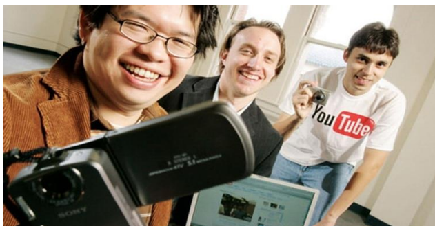
Ilustración. 4, Chad Hurley, Steve Chen y Jawed Karim, los creadores de YouTube

En el año 2005 se funda la plataforma YouTube de la mano de Jawed Karim, Steve Chen, Chad Hurley, el cual es un sitio web dedicado a compartir vídeos, lo curioso es que este sitio no produce ni la ínfima parte del contenido que ofrece. Su contenido presenta una variedad de video clips de películas, programas de televisión y videos musicales, así como contenidos amateurs[10]. Podemos definir Youtuber como una persona de influencia o algún tipo de celebridad de internet y videógrafo que ha ganado un nivel de prestigio debido a sus videos en el sitio web para compartir vídeos, YouTube.