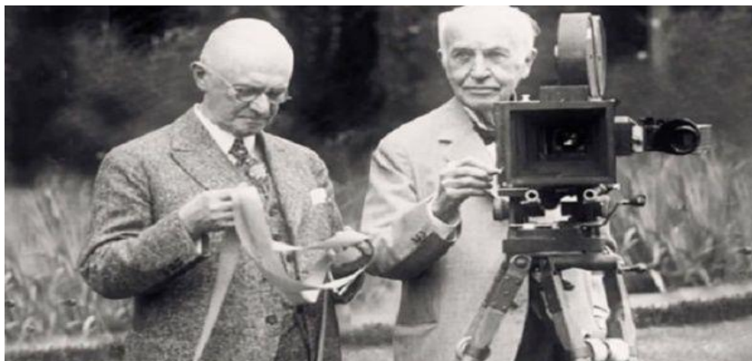
Ilustración 3, Hermanos Lumière [9]

A parte del cine existen otras plataformas de comunicación que han hecho uso constante de material audiovisual para comunicar un mensaje, una historia en los cuales tenemos la televisión, documentales, YouTube entre otros.