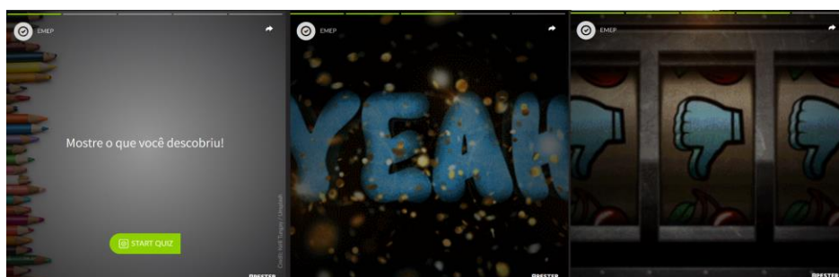
Figura 3: Quiz